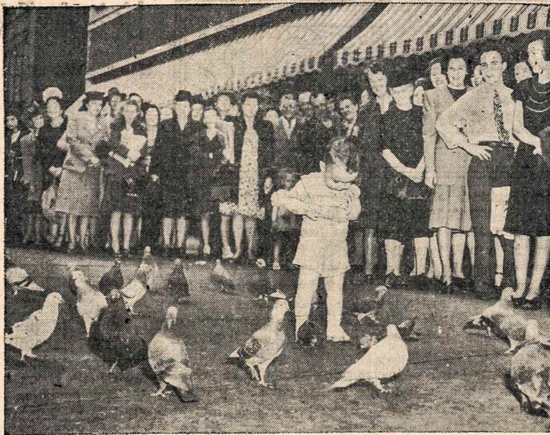
Tūlą popietį einant viena Chicago gatve praeviai pastebėjo mažą, 16-kos mėnesių vaikūtį, kuris taip gudriai mokėjo patraukti dėmesį ir save būrio balandžių, kad praeviai sudarė lyg koki parados stebėjimą.

NEW ENGLAND TELEPHONE & TELEGRAPH COMPANY