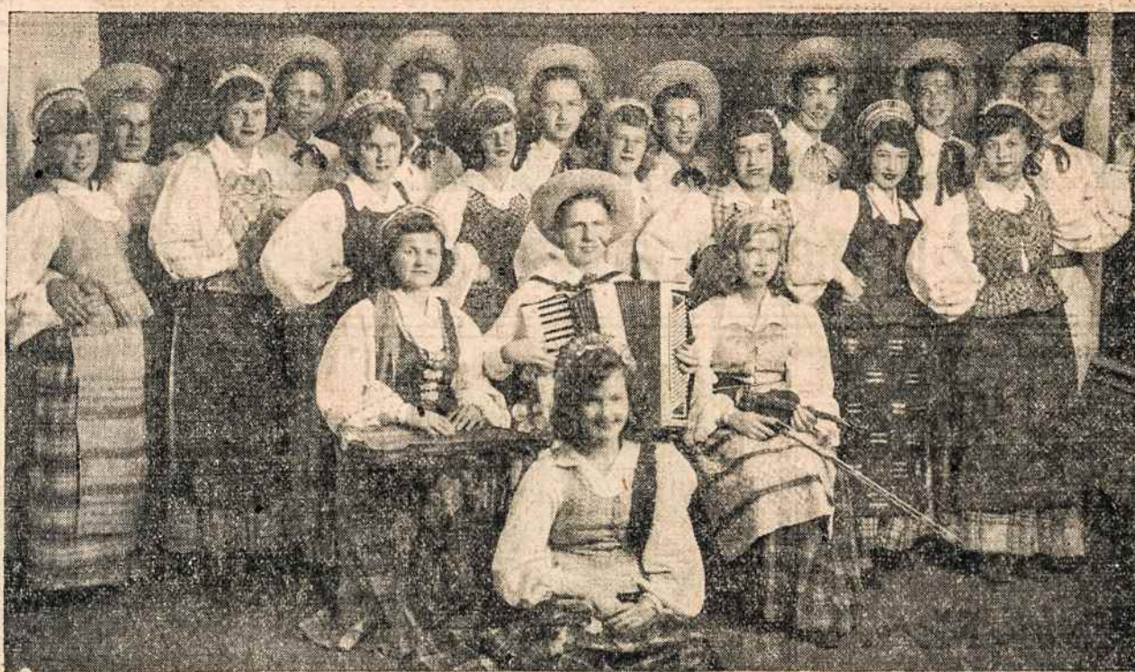
Bostono Lietuvių Tautinių Šokių Grupės

Res. Sou. 3729 Sou 4618 Lithuanian Furniture Co. MOVERS — Insured and Bonded Local & Long Distance Moving 326 - 328 W. Broadway SO. BOSTON, MASS.