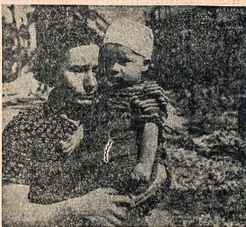
Atsimink tremtinius! Sušalusiesiems ir alkaniems nelinksms jiems bus Kalėdos...

— Vade, atvyko Stirnos Akys ir Stirnos Kojos. Iš Gedimino Kardo būrio. Vadas pakėlė galvą ir staiga išmeigė savo akis ne į vadovą, bet į paskutinį įėjusį kapitoną. Vadas staiga pakilo, nusiėmė ausinius ir puolė prie kapitono.