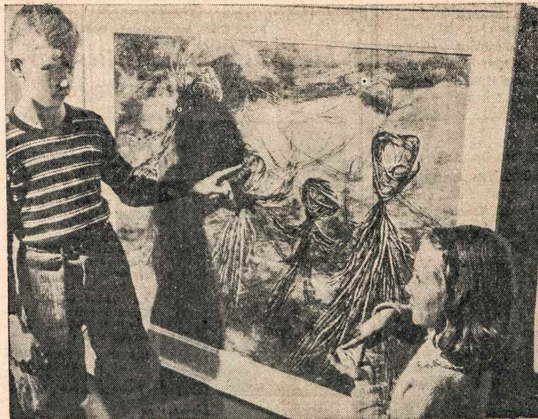
Kaip daugumas suaugusiųjų menininkų turi daug vargo išstatyti savo kūrinius parodoje, tuo tarpu vaikai, kaip šis paveikslas parodo, gavo progos Chicago's Art Institute pasirodyti.

Pasinaudodami suirutėmis, komunistai apiplėšė eilę bankų, turtingųjų ir jų partijos išdas, kaip tvirtinama, pasiekęs 84 milijonus dolerių. Nentostabu, kad panaudodama tokius išteklius komunistų partija rinkimuose laimėjo didžiausią atstovų skaičių — 163.