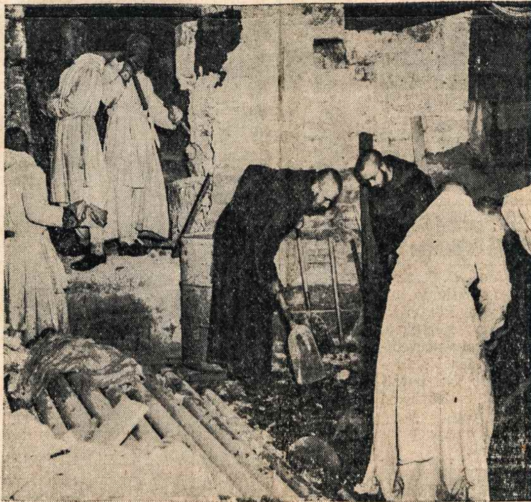
Dubuque, Ia, vienuoliai trapistai savo rankomis statosi vienuolyną. Jie patys atlieka visus darbus ir už metų bus gražus vienuolynui ramas baigtas.

Atstovai savo rezoliucijoje aiškiai pasako, kad komunistų ir fašistų valdžios forma yra totalitarinė ir priešinasi mūsų valdžios formai. Taigi komunistai ir fašistai negalimi vadovauti Amerikos darbininkų unijoms.