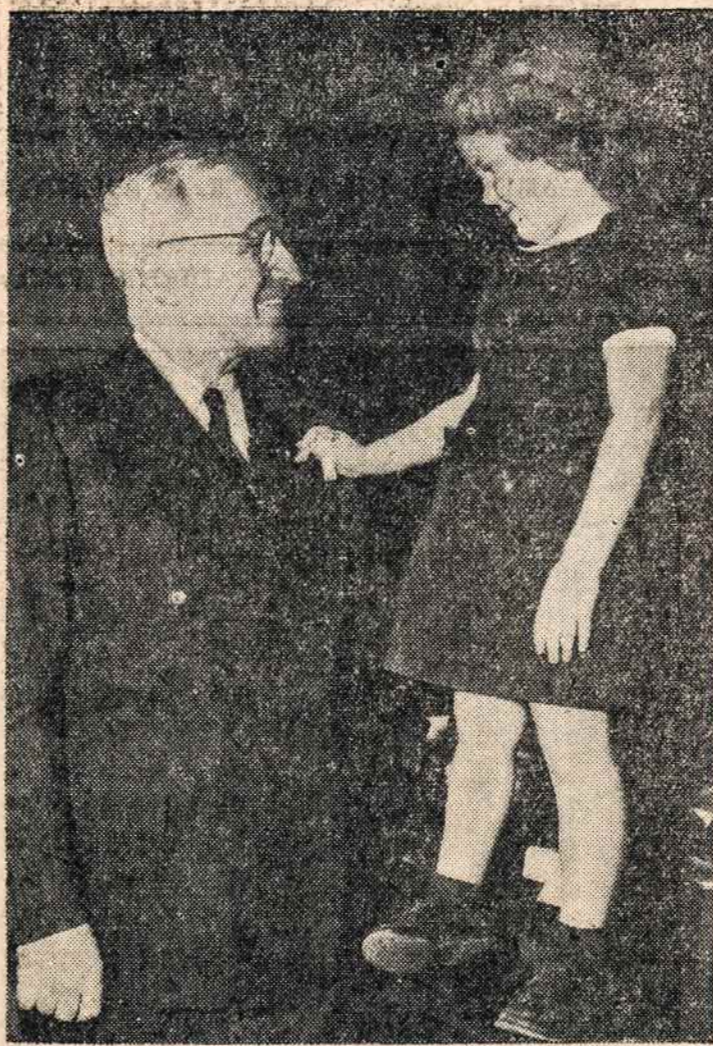
Sunkiai sužeistųjų karių metinio vėjau iš-pardavimo "Forget-Me-Not" proga, mažytė ve-teranų atstovė įteikia ir Prezidentui Trumanui vieną iš anų ženklų. Tas įvyko Alexandria, Va.

Jau tremtiniai priprato pergyventi tuos siaubus vadinamus skreaningais, kurie UNRRA laikais pa-reikalavo daug nekaltų aukų. Nors baigiantis UNRRA veiklai ir prade-dant kurtis naujai tremti-nius globojančiai organi-zacijai IRO buvo tikrinta, kad daugiau skreaningų nebebūs. Tiesa, buvo pa-minėta, kad IRO darys kokią tai patikrinimą, ku-ris bus tik klasifikacija tremtinių. Dabar jau pra-dėta praktiškai skreaning-ą vykdyti. Tremtinio šei-mos galva turi užpildyti tam tikrą ankieta, kurioje yra per 50 klausimų. Klausimai yra tiek smul-kūs ir taip giliai išnagri-nėja tremtinio gyvenimą, net ir kur gyvenai ir ką dirbai nepriklausomybės laikais savo tėvynėje. Ši-tokie klausimai atrodo, kad neturėtų nieko bend-ro turėti su šelpimo for-mos nustatymu. Kam šiandie svarbu ar tremti-nis 1935 - 1939 metais gy-veno Kaune ar šiauliuose. Be to daugelis 1941 me-tais turėjo slapstytis ir kaip jis šiandie gali nuro-dyti visas vietas kur jis buvo. Jei tremtinys para-šys teisybę ir sovietiniai agentai tai sužinos, tai to-kiu giminėms ir pažista-miems tėvynėje baigta. Kam gi IRO ponai tuo no-ri pasitarauti? Be to, prasidėjęs skryningas bri-ty zonoje Oldenburge ro-do jau pačioje pradžioje skandalingas davinius. Čia daugiausiai buvo gi-lintasi kodėl tremtinis ap-leido tėvynę. Per vieną dieną buvo apklausta 10 asmenų iš kurių 9 buvo pranešta, kad jie išjungia-mi iš IRO šelpiamųjų skaičiaus.