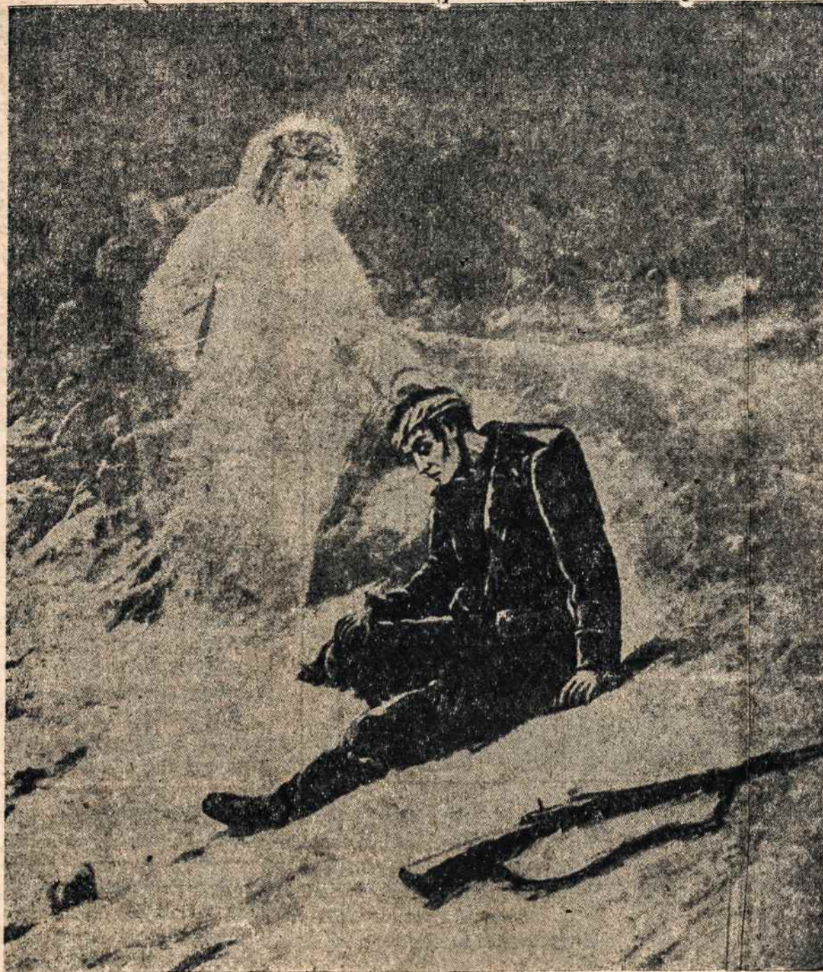
„Šiandien su manimi būsi rojuje“... Kristus Lietuvos žemėje guodžia mirštantį partizaną.