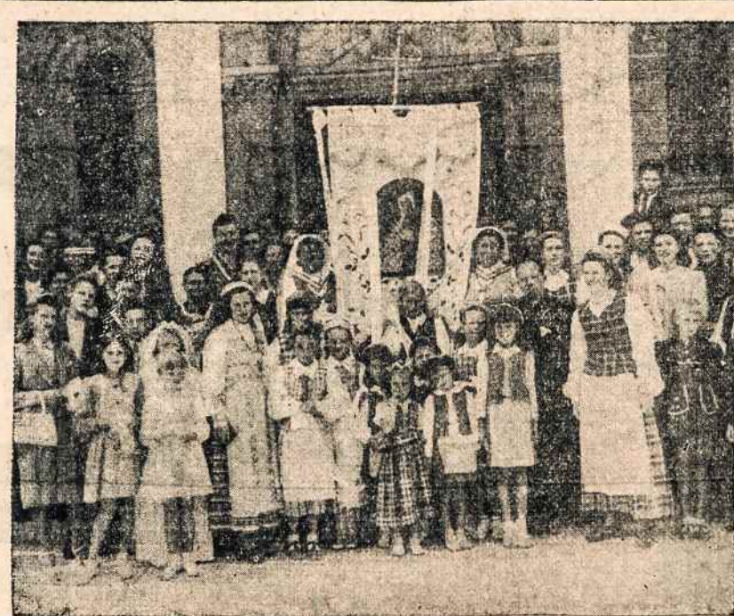
Argentinios lietuvių moterų ir mergaičių Draugija "Birutė" savo sukaktį atžymėjo gražia švente. Čia lietuaitės, tautiniai rūbais pasipuošusias, matome prie Aušros Vartų bažnyčios, Avellandoje.