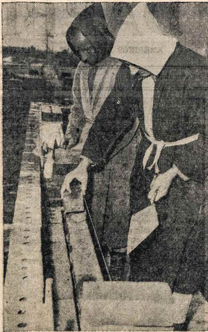
Du veteranai kariai įžengę į Trapistų vienuolyną gyvenimą vykdo savo dienos darbą. Jie dirba po septynias valandas kasdien. Jiems negalima su niekuo kitu kalbėtis tik su savo vyriausioju - viršininku. Jie gyvena Conyers, Ga. ir jiems tas pašaukimas patinka.

Kadangi toji moteris negalėjo ateiti į teismą, tai teismas namo savininkui davė leidimą. Dabar toji senutė nežino ką daryti. Ji neturi kitos vietos. Kada jos paklausė, ar turi kur eiti, tai ji drebančių balsu atsakė: "Ne, aš neturiu vietos. Aš sergu. Aš pasitikiu Dievui ir žinau, kad Jis mane globos".