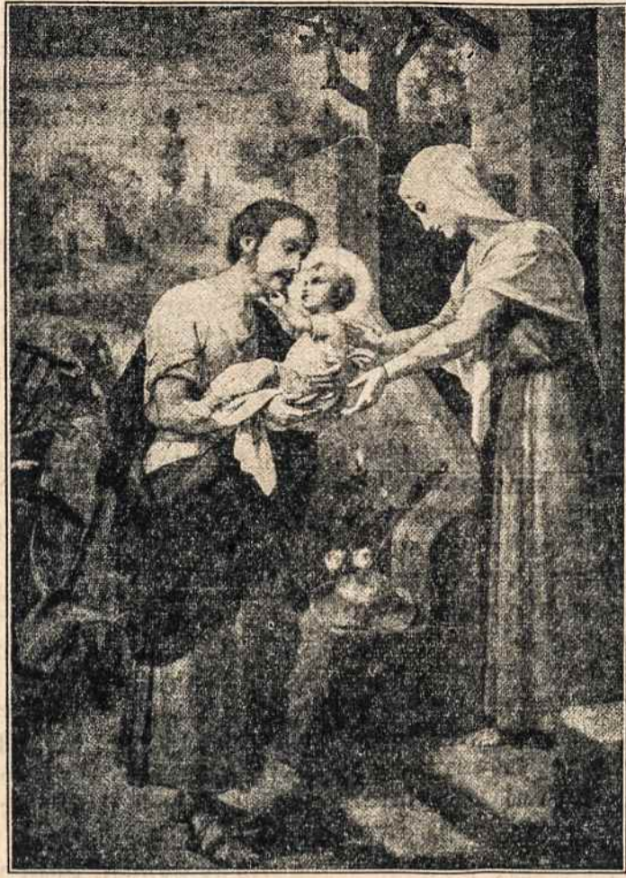
Šventoji šeima — gerų šeimų pavyzdys.

Begalinis tikėjimas, nežemiška kantrybė ir nuolatinė meilė — štai Marijos gyvenimo papročiai, kurie gaivina visas maldingas šeimas. Iš tų Marijos pavyzdžių sau stiprybės būsimajam gyvenimui semiasi ir sodalietė. Toj maldingoj dvasioj ir kiekviena šeima, pagal saiką, dedasi su svetimu Dievo valią, lengvai neša ir gyvena nedoruose bei "džiaugsmuose". Ir va-