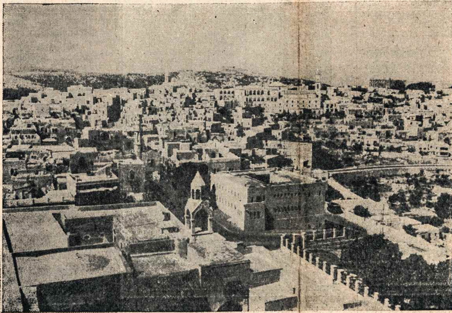
BETLIEJUS, kur prieš devyniolika šimtų metų gimė Jėzus Kristus. Šiandieninis miestas dar turi daug senovės palaikų. Jis atrodo turis mišinį senovės ir moderniškojo amžiaus. Laike Šv. Kalėdų visas krikščioniškas pasaulis kreipia savo akis į tą miestą, kur gimė Jėzus Kristus, atnešęs geros valios žmonijai ramybę.