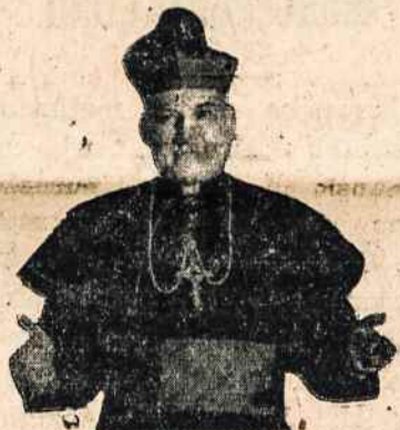
J. E. Arkivyskupas Richard J. Cushing, D. D., Carney Ligoninės Statybos Fondo globėjas ir Lietuvių Komiteto Garbės Pirmininkas.