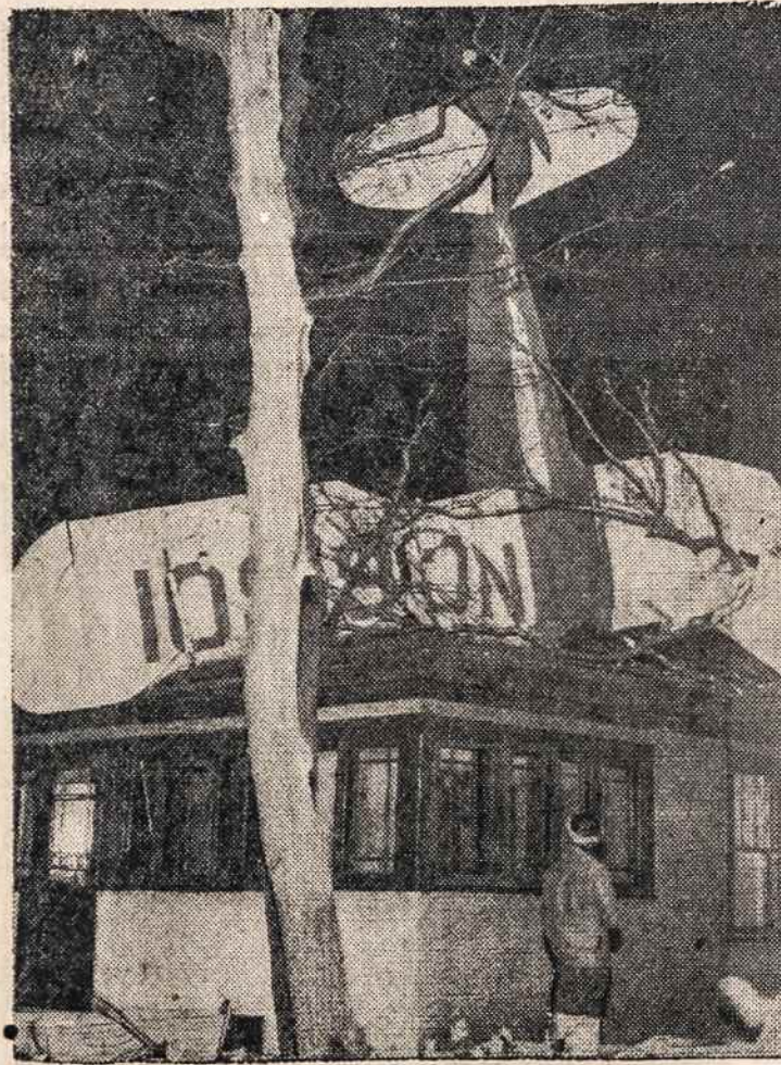
Waukegan, Ill., lėktuvas taip žemai skrido, kad užkliuvo už medžių ir krito ant namo. Policija pribuvus patyrė, kad lėktuvo vairuotojas buvęs išsigėres ir jį areštavo. Tai dar vienas įrodymas, kad gėrimas neveda į gerą, bet į blogą ir prie rimtų darbų reiktų su juo lenktis.

Recenzijoje nurodoma, kad tos išpūdingos knygos autorius yra vadovaujantis lietuvių pasipriešinimo pogrindžio kovoms asmuo, patsai išgyvenęs abi totalitarines okupacijas — hitlerinę ir bolševikinę. Šia proga pažymėtina, kad minimas Suduvio veikalas yra LAIC'o peržiūrėtas, papildytas slaptais NKVD dokumentais ir baigiamas