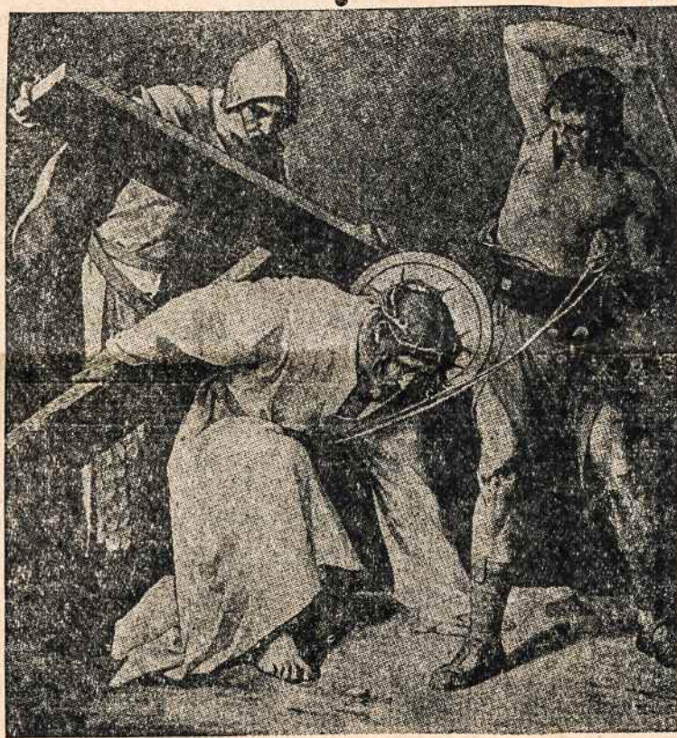
Per savo merdėjimą ir kančią, gelbėk mus ir mūsų tėvų kraštą — Lietuvą, Jėzau!

O, neklausk, kokie jausmai užliejo tavo širdį, kada tu stovėjai prie atviros duobės savo mylimo žmogaus arba mintyse nuleisus jumis." Ir, žinodamas, dai į kapą savo kūdikį, kada Jis yra kartu su sa-