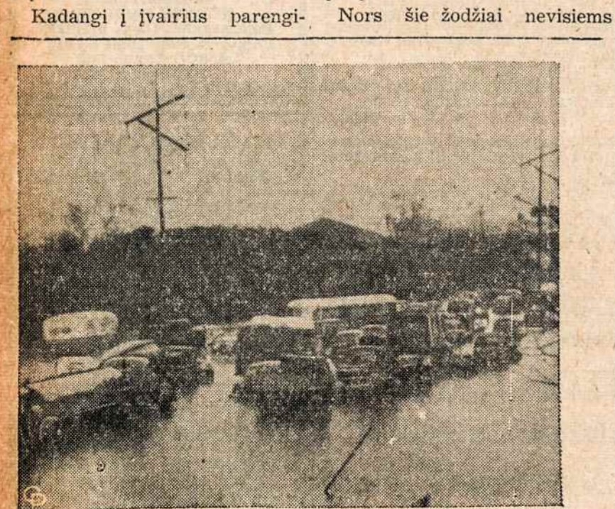
Vaidzas parodo potvynio užlieta New Orleans miesto gatvę ir ten vandenį mirkstančius busus, automobilius ir trokus. Lietus buvęs toks smarkus, kad iškrito 10.78 colių vandens ir užlie- jo visas miesto gatves.

Dabar pravartu prisiminti, o rūsies paklausimų buvo So. kur gi Amerikos lietuviai gau- na lietuviškumo pastiprinimą, tes lietuvis paklausė: "Tur būt kad taip ilgus metus emigraci- ir at Lake Success yra lietu- joje liko patrijotais? Čia juos gaivina: Bažnyčia, spauda, or- ganizacijos, parengimai. Baž- nyčia padeda tik tiems, kurie nori susijungimo turi pa- į ją ateina ir dar tiek, kiek lietuvių kunigai yra lietuviški ir moka lietuviškumą skiepyti. Amerikos lietuvių spauda yra grynai srovinė, organizacinė, kuri apima visas pažūras, vi- sus sroves, visas organizacijas. Todėl per spaudą šiandien ir pa- išsireiškia visų pakraipų, sro- vių pažūros į kitus ir tų sro- vių tikslai.