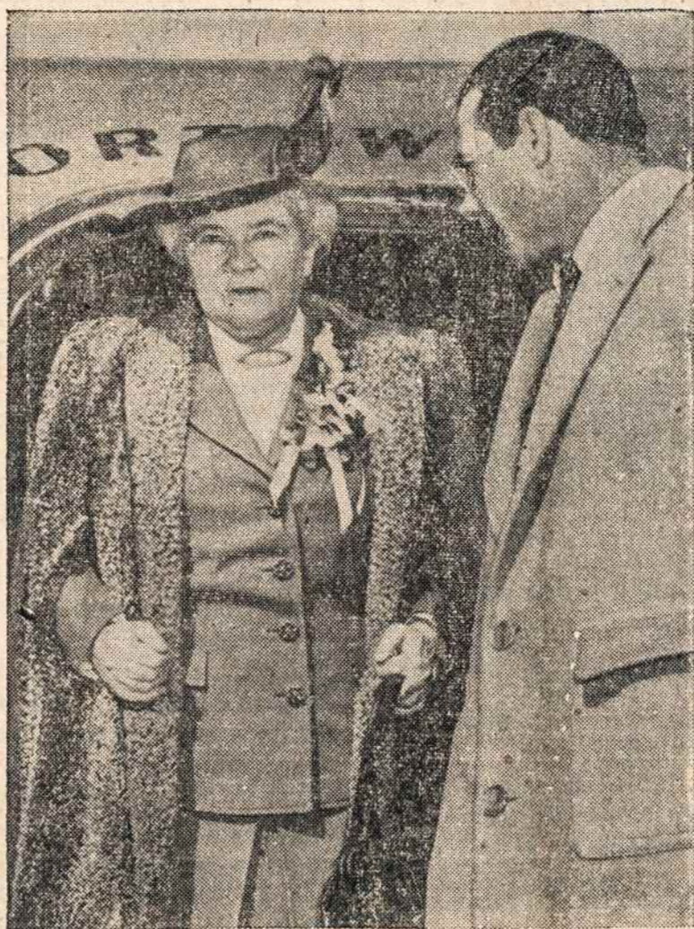
Sešuo Elizabeth Kenny, žymi kovotoja prieš polio ligą, atvyko iš Minneapolisio į New Yorką, kad įsteigus naują šaką ligoninės polio ligos gy- dymui Jersey City.