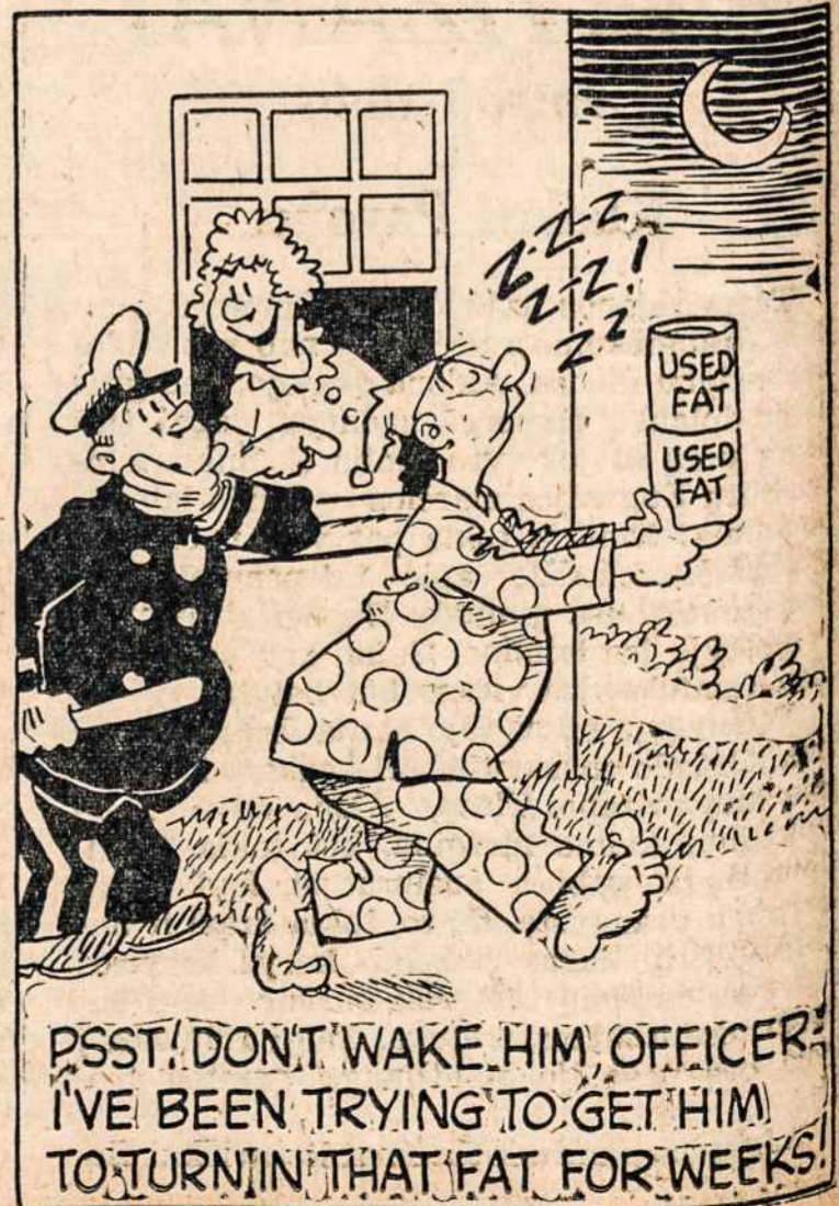
PSST! DON'T WAKE HIM, OFFICER! I'VE BEEN TRYING TO GET HIM TO TURN IN THAT FAT FOR WEEKS!

Tel. Lexington 8595 Litosinai dėl visokių reikalų. Patarnavimas Dieną ir Naktį.