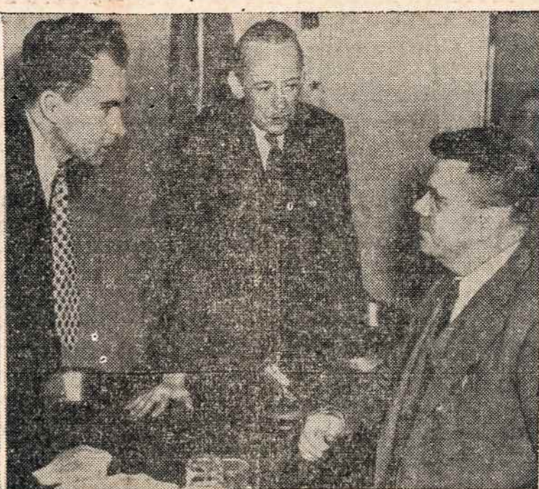
Atsarga gėdos nedaro. — Kai Dr. Edward U. Condon, buvo paskirtas Bureau of Standards direktorium, Washington, D. C., tai Komercijos departamento Sekretorius Harriman (kairė), remdamasis Un-American Activities subcommittee daviniais, apie Dr. Condon ištikimybę tam svarbiam ofisui, suabejojo. Dr. Condon (dešinė), buvo apklausi-nėtas dėl kaikiurių klausimų. Paveikslas parodo dalykų išaiškinimą.