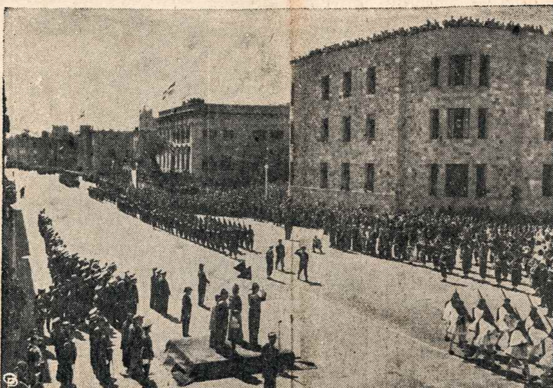
Graikijos karalius priima parada ir sveikina sugrįžimą prie Graikijos Dodecanese Salų, kurios per šešis šimtus metų buvo valdomos svetimųjų. Dodecanese Salos buvo gražintos Graikijai taikos sutartimi su Italija.

Tokių tikėjimas ir j Lietuvos Prisikėlimą yra tuščias.