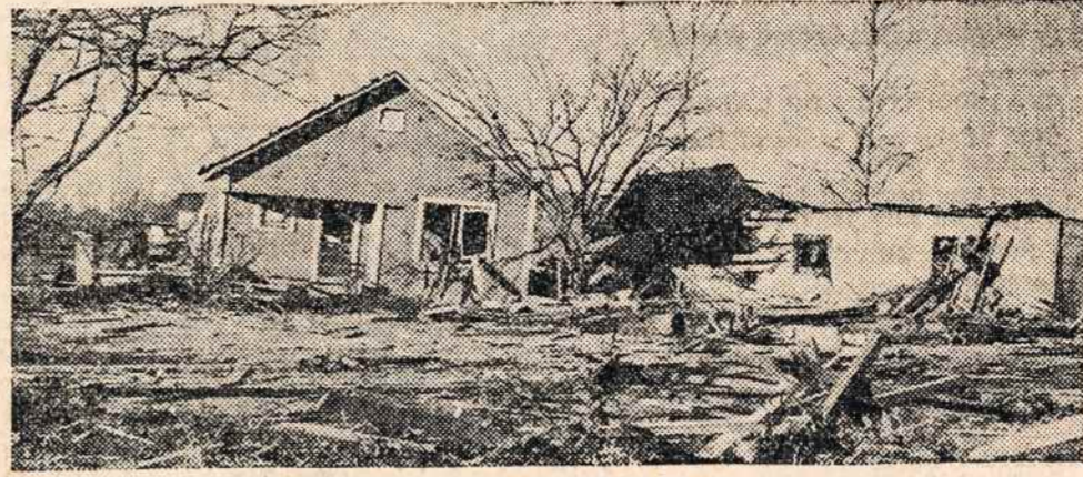
a tornado imprisons them in the wreckage of their home