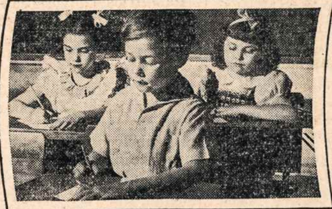
Jaunieji mokykloje rūpestingai darbuojasi...