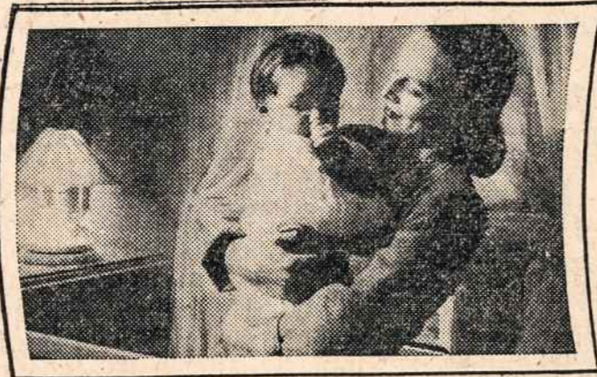
A mother is putting her child to bed . . . . .