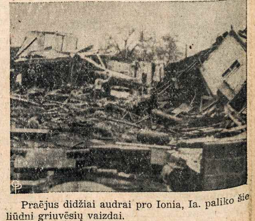
Praėjus didžiai audrai pro Ionia, Ia. paliko šie liūdni griuvėsių vaizdai.