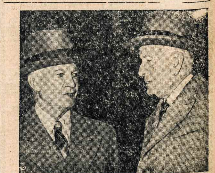
Gen. Dwight Eisenhower (kairėje) jau "pilietis". Jis ir buvo pilietis, bet buvo ir karys. Gi dabar civilisė pareigose ir štai priėmęs naujas pareigas Columbia universiteto prezidento, tariasi su vienu iš kolegijos trustistų.

AMERIKOS VYRIAUSYBĖ MUS UŽTARIA Kiekvienam laivu iš Europos atvyksta lietuvių ir mielai laukiami. Jiems gelbsti Lietuvos valstybės istaigos: pasiuntinybės ir konsulatai. Oficialiu pareiškimu Valstybės Departamentas kovo 29 d. paskelbė pasauliui, kad J. A. Valstybės niekad Pabaltijo valstybių: Latvijos, Lietuvos ir Estijos nebuvo pripažinusios prijungtą prie Sovietų Sąjungos. Valstybės Departamentas išsiuntinėjo 48 valstybių gubernatoriams laiškus, kuriuose aiškiai pabrėžė, kad Amerika Baltijos kraštus laiko nepriklausomais ir jų konsulatui bei pasiuntinybė Amerikoje pripažįstami ir veikia.