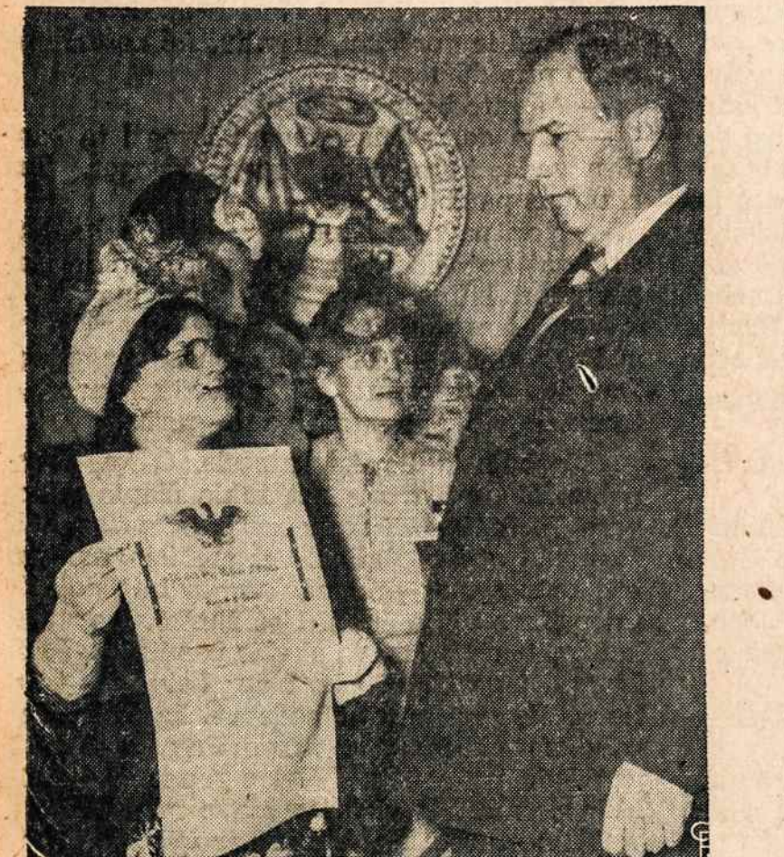
Illinois valstijos Auksinės žvaigždės karių motinos atvykusios delegacija į Washington, D. C., ir atsilankydamos su vizita pas Armijos Sekretorių Kenneth Royall, už didelės pastangos gražinti žuvusių karių kūnus į šią šalį, įteikė jam nuoširdžios padėkos raštą.

KITI RŪPESČIAI IR SUMANYMAI Prieš akis dar daug reikalų. Seselės nori prie Motiniškojo namo Putnam, Conn., pastatyti Nekaltai Pradėtąją Šv. Panos Marijos garbei koplyčią, kur bus meldžiamasi už Lietuvą, visą pasaulį ir geradarius. Šiam sumany-