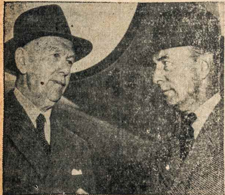
Dėl labai svarbių priežasčių iššauktas iš Bogotos konferencijos Jung. Valstybių valstybės Sekretorius George C. Marshall (kairėje), sutinkamas tik iškėles koją iš orlaivio pasekretorio Robert A. Lovett, Washington, D. C. Tarp svarbiųjų klausimų yra ir Palestinos reikalai.