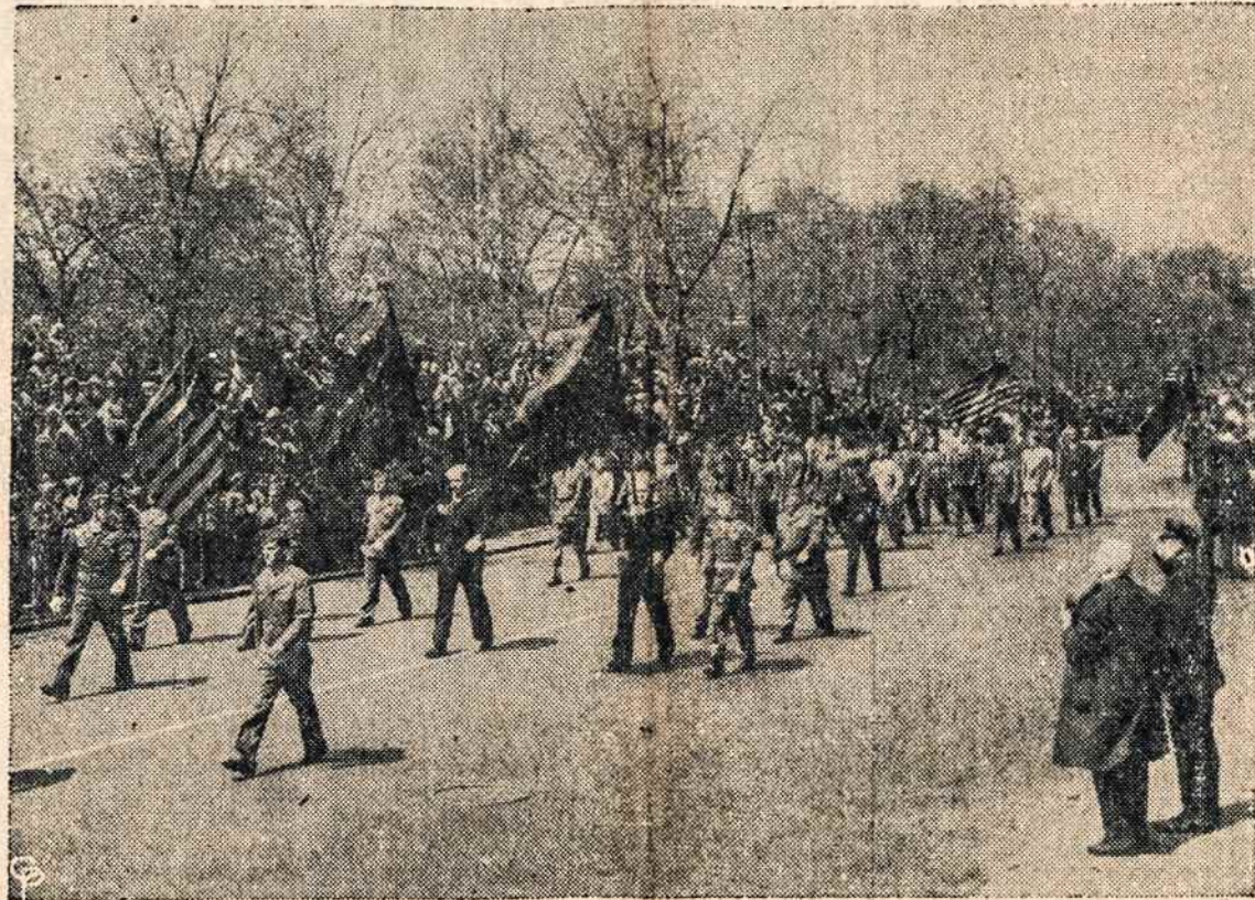
Amerikos kariai - veteranai New Yorke paskelbė Lojalumo diena, vietoj komunistų dienos, ir sudarę milžinišką paradą paradojo Fifth Avenue. Kairieji irgi maršavo 8th Avenue, kur nebuvo nei dešimtos dalies to skaičiaus dalyvių, kaip kad turėjo patriotingieji kariai-veteranai.