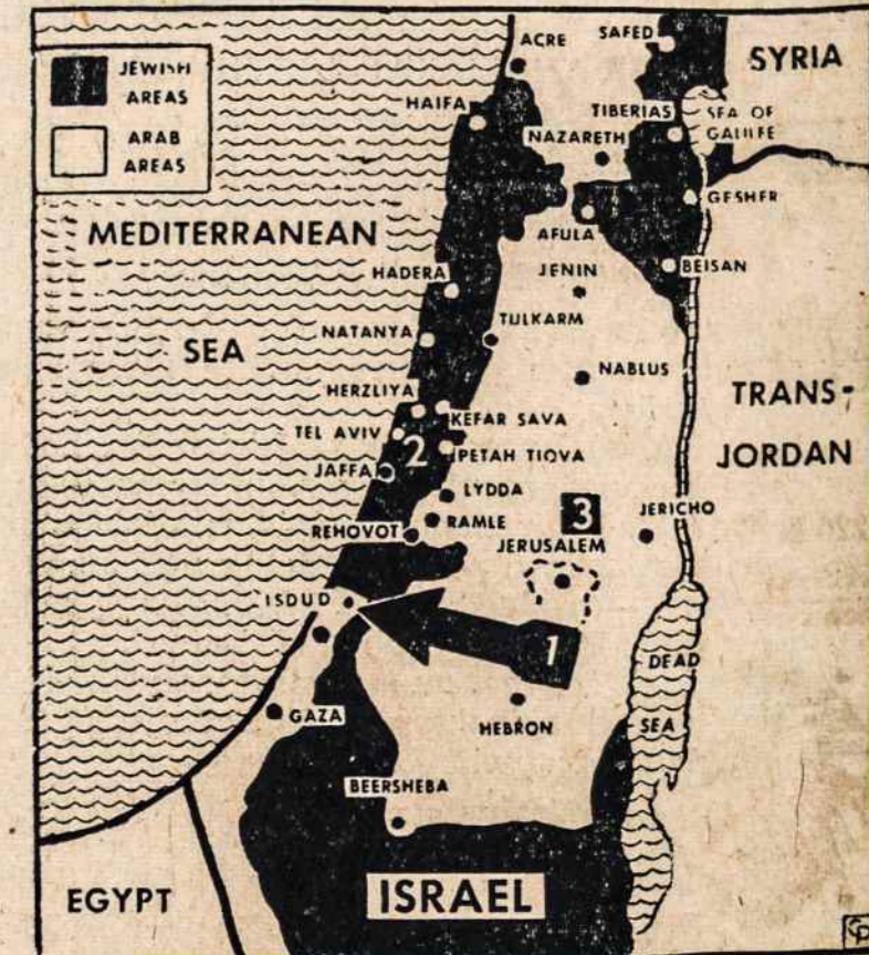
Žemėlapis parodo juodai dažytas sritis žydų kontroliuojamas ir baltas — arabų. Laikė kariškų susikirtimų ir žydų su arabais ir buvo iš įvairių vietų pranešimai.

DARBININKAS 366 W. Broadway, South Boston 27, Mass.