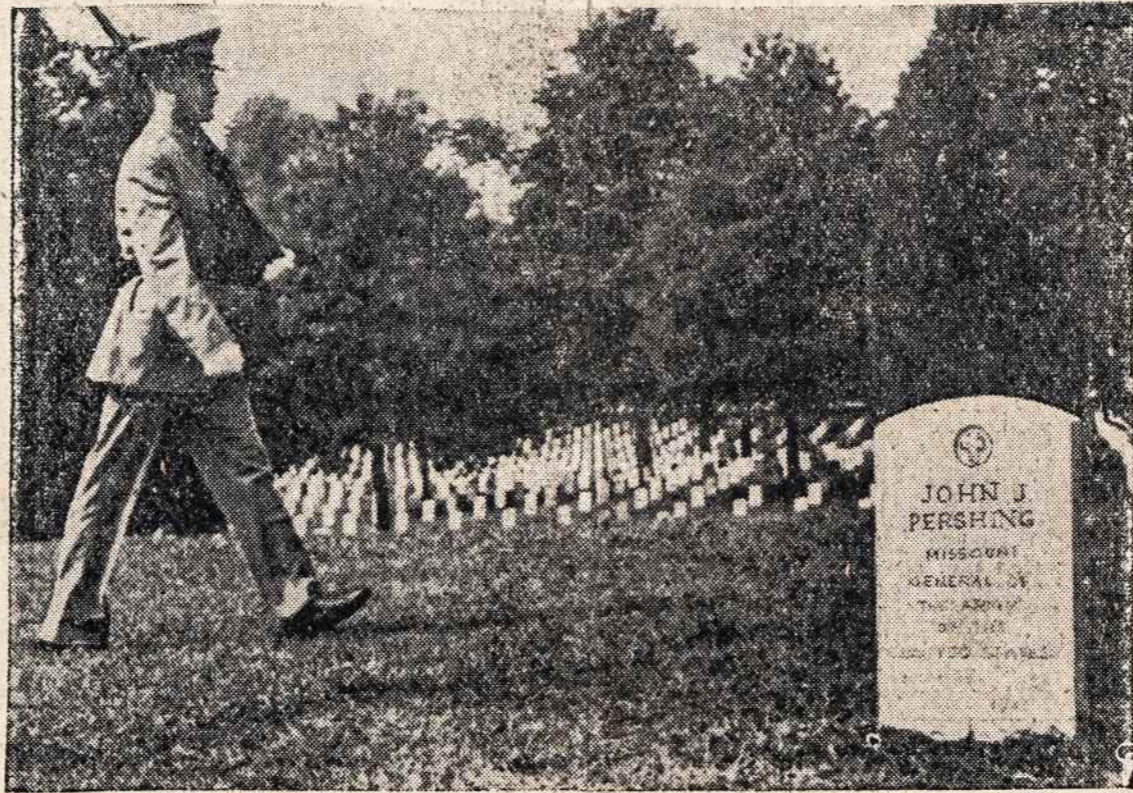
Tautinėse kapinėse, Arlington, Va., išdygo naujas kapo paminklas, ant kurio pažymėta, kad čia ilsisi amžinu miegu generolas John J. Pershing, pirmas nuo Washingtono to laipsnio generolas. Šios šalies papročiu mirus generolui per 72 valandas prie jo kapo einama garbės sargyba, ką mes čia ir matome. Taipgi per 30 dienų visose armijos stovyklose nuleidžiama vėliava iki pusės masto, gedulo atminimui.