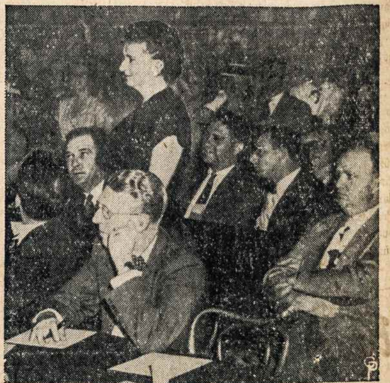
Vaizdas parodo tarp sėdinčių žmonių ir stovinčią moterį. Tai Elizabeth Bentley, Sovietų Rusijai tarnavusi slapta agentė, kuri neseniai pametusi tą tarnybą išvelka aikštėn šios šalies visą eilę valdininkų, kuriuos ji įrodinėja tarnavusius Sov. Rusijai perduodant laike karo slaptas žinias.