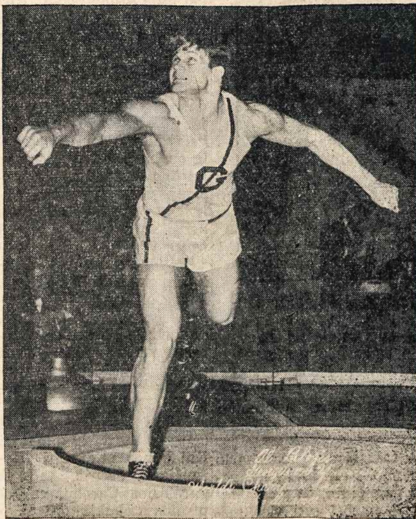
Lt. Al Bložis

Rugpiūčio (Aug.) 29-tą, Naujos Anglijos Vyčiai rengia "Lt. Al Bložis Dieną" pagerbti žuvusį lietuvių sportininką.