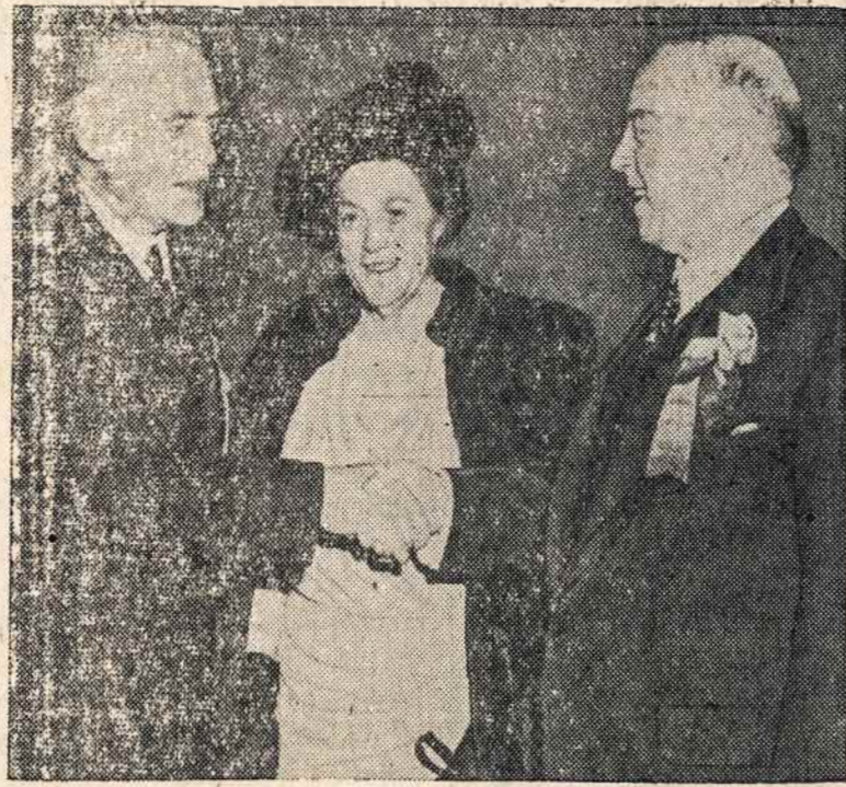
Kai neseniai praėjo Kanadoje rinkimai ir daugumą balsų surinko Liberalų partija tai sulig jų įstatymų toji partija skiria savo ministerį pirmininką, kuris sudaro ministerių kabinetą. Šis vaizdas parodo (kairėje) naują Liberalų partijos kandidatą į tą aukštą vietą Louis St. Laurent. Jį sveikina dabartinis ministras pirmininkas William L. Mackenzie King.

Kiekvienais metais Santiage ruošiamas Karmelio Mergelės garbei didžiulė procesija, kurioje dalyvauja ne tik santiagiečių minios, bet ir iš provincijų atvykusieji, ne tik žymiausiai Bažnyčios atstovai bet ir valdžios vyrai ir kariuomenės daliniai. Ir ne vienam toje procesijoje nešamam papindulių šviesoje, arba, veikslui ar statulai tiek nešaukiama "tegyvuoją", ir neplojama, kaip kad Karmelio Mergelės. Rodsioji suspindi stiprių protiektorių šviesoje, tada tai nas pamatęs tą statulą: