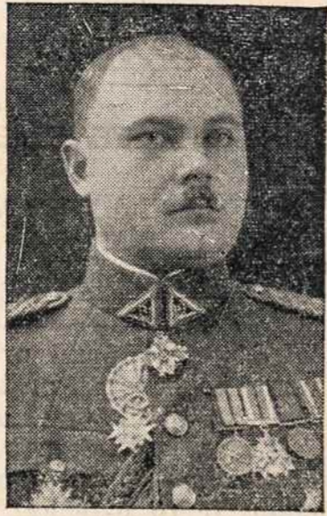
Generolas Jonas Černius