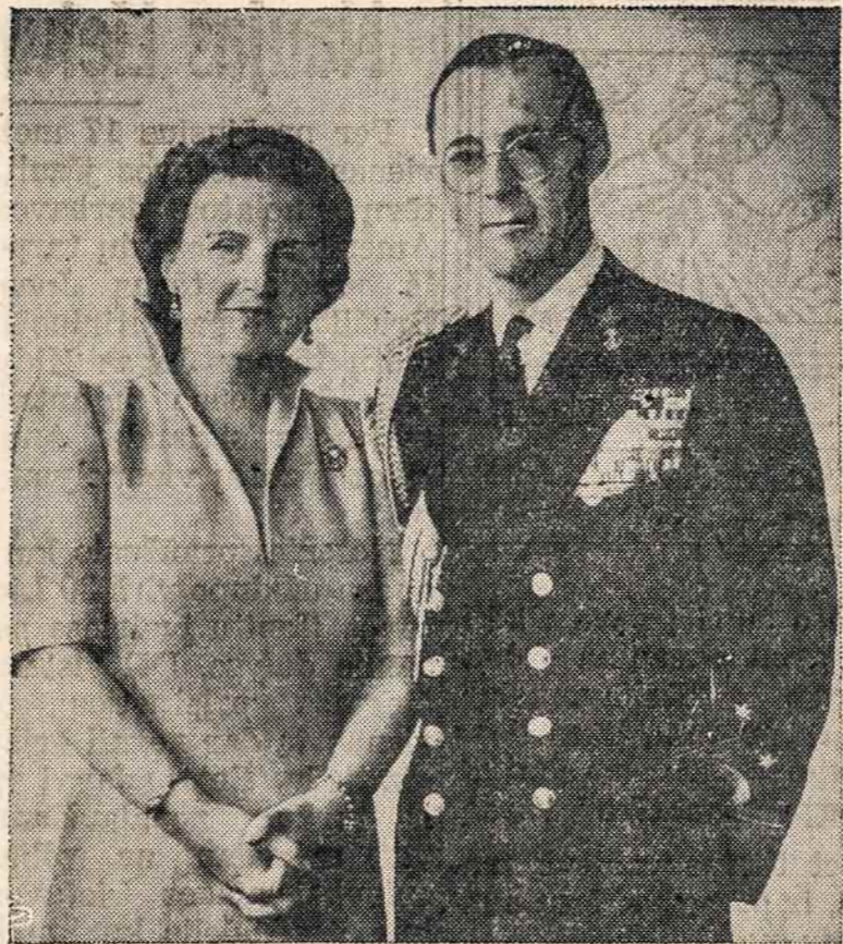
Rugs. 4 d., pasitraukė iš karalienės sosto Olandijos karalienė Wilhelmina. Jos vietą dabar užėmė ši paveiksle matoma Princess Juliana.