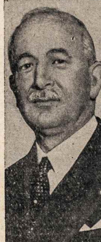
Dr. Eduard Beneš, kuris prieš keletą dienų mirė. Milijonai čekų gedulu pasipuošė dėl mirusio jų paskutinio prezidento gy-nusio tos šalies laisvę ir nepriklausomybę.

Forumui pasibaigus, įvyks palaiminimas šv. Sakramentu šv. Jurgio lietuvų parapijos bažnyčioje. Tuo ir baigsis LDS Seimas.