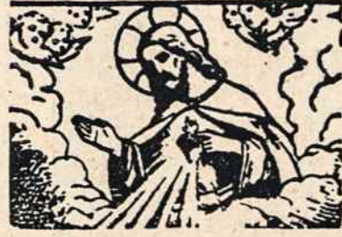
Vertė A. Maceina.