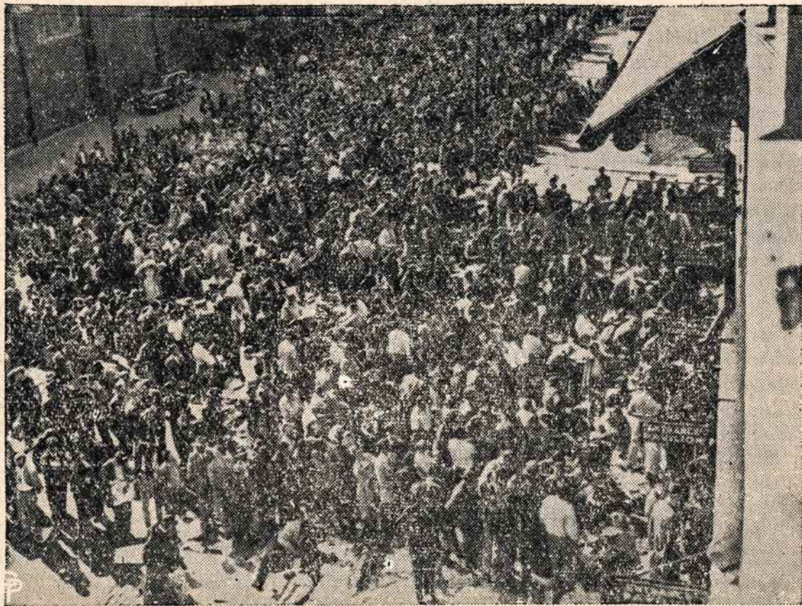
Kada Sporto rateliai jau baigia savo baseball sezoną tai jų aukš- čiausių laimėjimų davinius pasiekę atlieka paskutinius susiliktimus ir tie aukščiausiasieji arba paskutiniai siekiai laimėjimo vadinami World Series yra labai populiarūs. Tą liūdią ir šis paveikslas, kada bu- vo atidaryti įžangos tikiųjų pardavimo langeliai Braves Field, Bostone, jie buvo apgulti šios minios.

Atsižvelgiant į viešą gailęstį, visi pašalintieji, išskyrus Trockį, vėl prii- mami į partiją.