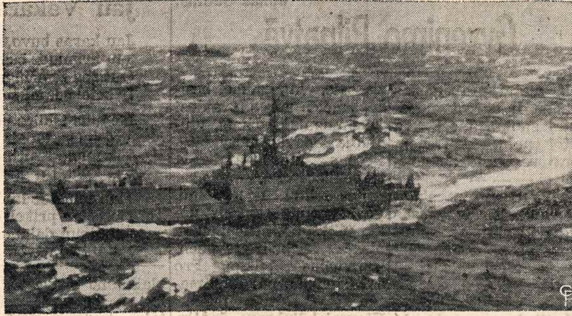
Per 56 valandas LCI 1093 karo laivas kovojo su audringa jūra. Tolumoje Laivyno destroyeris buvo atvykęs su pagalba ir nuolat gėbėjo. Praėjus pavojų destroyeris pasuko į Philadelphia, o šis laivas vyksta Cape Henry, Va. kryptimi.

We regret to state that the United States which more than any other nation made possible the military victory over the Axis Powers, has failed up to this time to extend any help to the victims of the Soviet aggression. The Soviet rulers apply ever harsher methods of oppression and outright annihilation of the indigenous Baltic populations. Arrests, executions, and mass deportations to the slave labor camps in Russia are continue without interruption. The peasants are forced to join the so-called collective farms-kolchoses. Lithuanian women are compelled to divorce their husbands who fled into exile and to marry new settlers from Russia. Im-