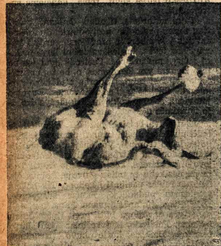
Garsūs Woming Red Desert, kur medžiotojai medžiojo antilopas ten sulig pranešimų ir kaip šis paveikslas liudija, daug sušalo anų gyvulių nuo šalčio ir negalėjimo surasti maisto.