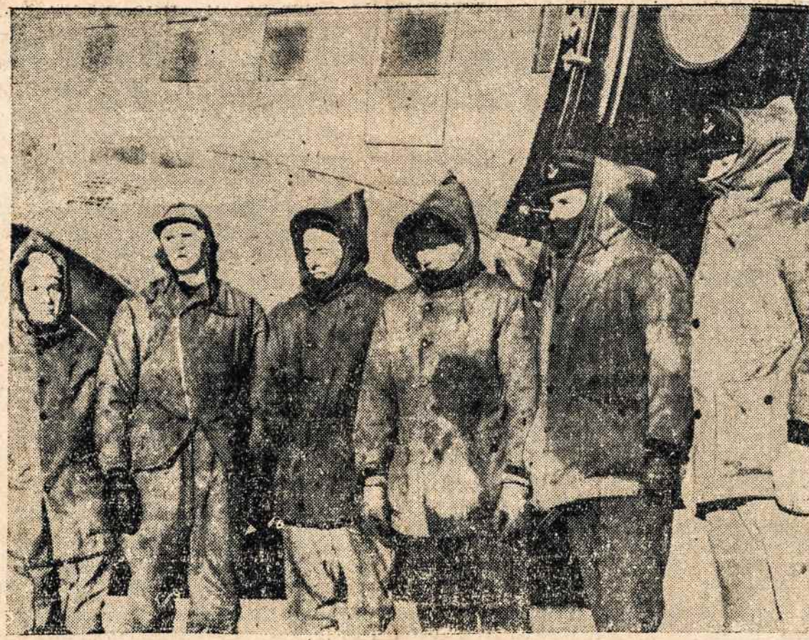
Šiomis dienomis didžiulis Britanijos lėktuvas buvo priverstas nusileis šiaurėje Hudson Bay ledynuose. Radio pagalba buvo iššaukta pagalba. Ir štai šie žmonės antrojo lėktuvo pastangomis buvo išgelbėti.