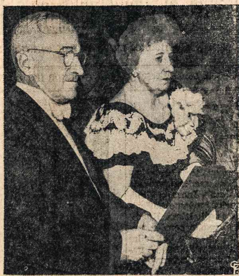
Nors jau Prezidento Trumano inauguracijos ceremonijų laikas nutolo, bet vaizdai dar seka. Štai pirmoji garbės pora inauguracijos iškilmėse — Prezidentas Trumanas ir ponija kaip 32-ras Jung. Am. Valstybių Prezidentas.

Sausio 17 d. per Bostoną atvyko pirmoji 43 ukrainiečių ūkininkų partija.