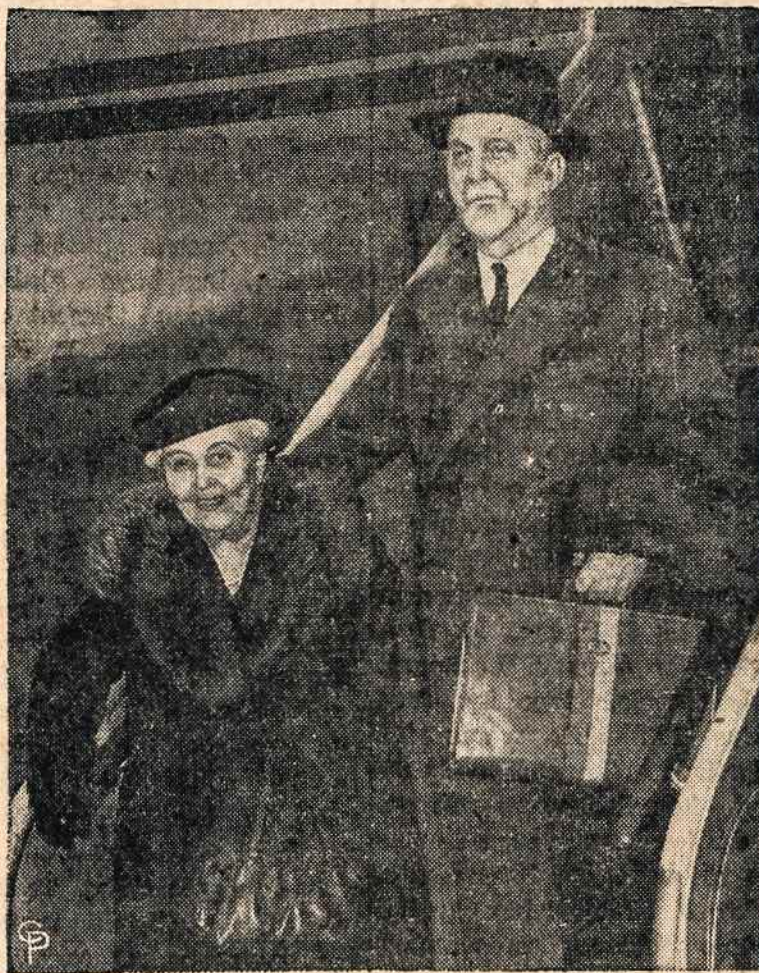
Šiomis dienomis atvyko Italijos (čia matomas) Užsienių Reikalų ministeris Count Carlo Sforza su žmona. tartis Atlanto Pakto reikalų su JAV vadovybe. Italijos Parlamento nubalsavo ir užgyrė Atlanto Pakto pasirašymą.

— Šiandien esu jau keturių vaikų motina. Viskas laimingai praėjo. Jaučiausi sveika, ir nieko man netrūksta. Man yra šviesiau sieloje ir gyvenimas pradeda geriau klotis. Atlikdama savo pažadą,