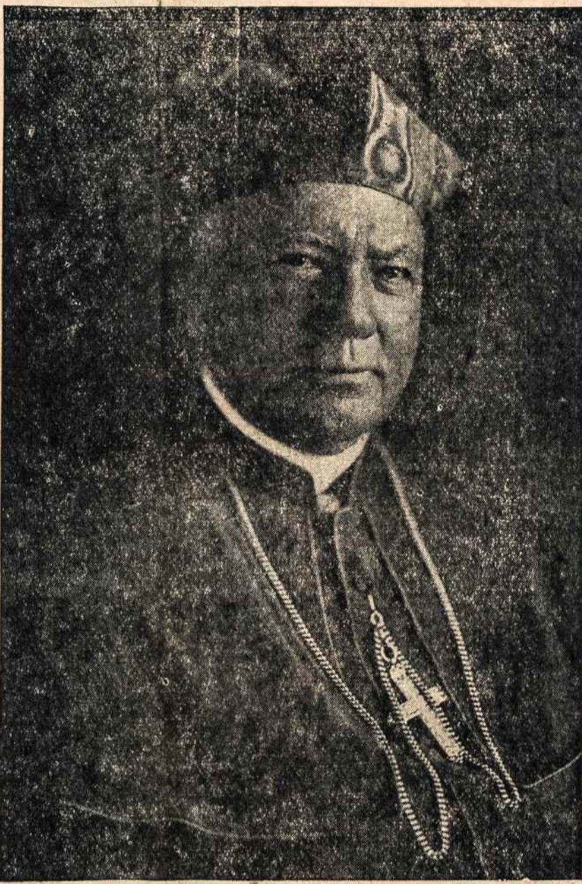
Šiandien suėjo penki metai kai mirė a. a. Jo Eminencija, William Henry, Kardinolas O'Connell. Jis buvo penktas Bostono vyskupas ir antras arkivyskupas. Jo vietą užėmė Arkivyskupas Cushing, buvęs jo vyskupas pagalbininkas.