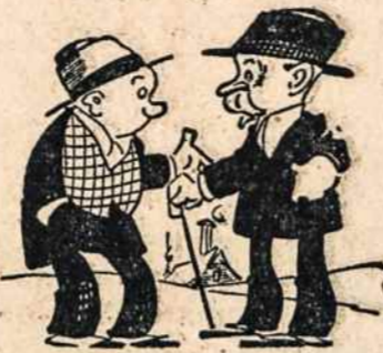
"Ruošiamės į Pikniką".