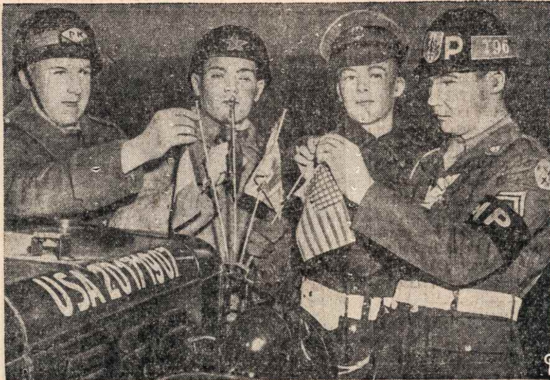
Nežiūrint įvairių ginčų tarp Rytų ir Vakarų, tarptautinėje militarinėje policijoje bendradarbiauja Vienoje ir toliau, palaikydama Austrijos sostinėje tvarką. Keturių Alijantų: prancūzų, rusų, britų ir amerikiečių okupacinių pajėgų MPs puošia autovežimo (džypo) priekinę dangtį savo kraštų vėliavėlėmis. Ji palaiko tvarką ten, kur Austrijos policija negali kištis.

Vilnius, atsimenant mažų miestelių ir kaimų skurdą, sudaro kitokį išpūdį. Būtina pažymėti, kad gyventojai vaikšto padoriai apsirėngę, kad negalima pastebėti skurdų, kokių ten visuomet pasitaikindavo. Taipgi pažymėtina, kad žmonės tullenksti, kūdikius, motiną ir batai yra gerokai apdė-