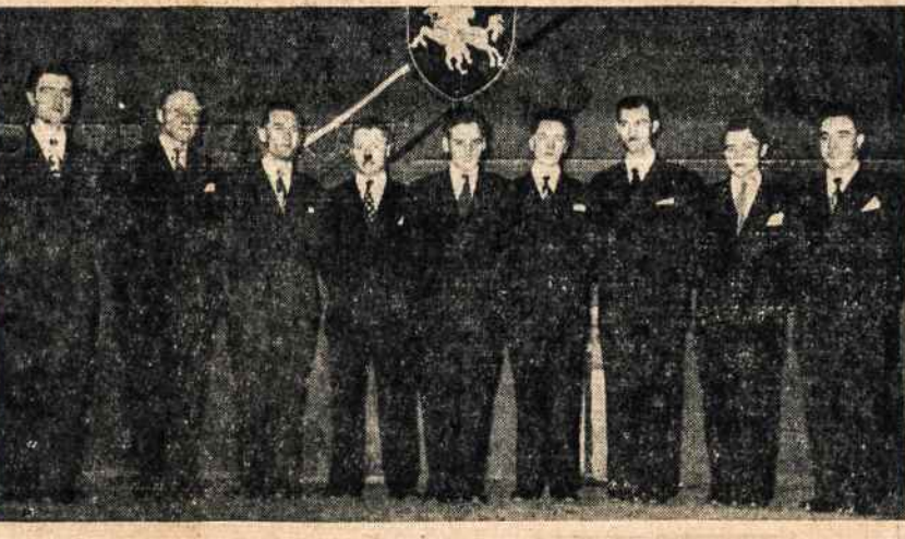
Toronto Lietuvių Oktetas

Šiuo metu atvyko į Kanadą ir jo našlė žmona su maža dukrele. Toronto Sąjungos Skyrius ėmėsi iniciatyvos lietuvių visuomenėje parinkti aukų ir tuo paremti vėliuonies našlę. Aukų prie bažnyčios sekmadienį buvo surinkta iki 80 dolerių. Dešimt dolerių pridėjo Sąjunga iš savo iždo. Tikrai gražiai pasielgė Toronto Lietuvių Sąjungos Sky-