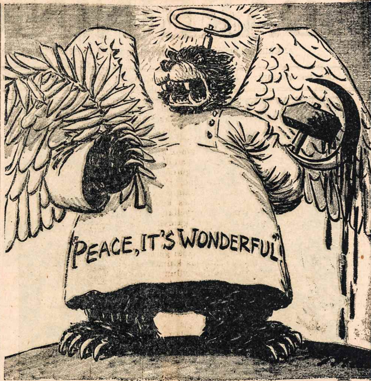
Sovietų Rusijos taikos apgaulė. Tačiau ji savo "taika" nebegali apgauti.

Tavęs, Amerikos lietuvi šiandieną klausia ir iš- kankintoji Lietuva ir vi- šų, visų lietuvių į tave nu- kreipti žvilgsniai, ar tu jauti, kad tu daugiau, ne- gu bet kur kitur esąs lie- tuvis, turi savo rankose lietuvių tautos ateitį ir kad tau šiuo metu lemta suvaizdinti tokios svarbos lietuvių tautos atžvilgiu vaidmenį, kokio dar lie- tuvių tauta nėra turėjusi. Lietuvių tauta prašo ir ti- ki, kad tu ir toliau didvy- riškai ištiesi savąjį tau- tai gelbstinčią ranką, kaip tu jau ne kartą darei ir, amžiais su lietuvių tauta būdamas gyvas lietuvis, neši lietuvių tautai naują atgimimą o Lietuvai lais- vę. Ar tavo sąžinė jau pa- juto šį lietuvių tautos bal- są ir ar tu jau davei į tai