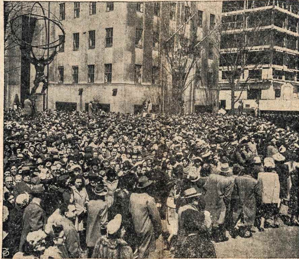
Žmonių minios vyksta į tradicinį Velykų parodą, Fifth Avenue, New York. Matome nuotraukoje tūkstančius žmonių spaudžiantis prieš šv. Patricko katedrą. Kai minios žmonių užpludo gatves ir išėjo stebėti to puikaus istorinio parodo, visas auto judėjimas buvo tame rajone sustabdytas.