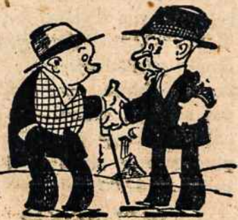
"Ruošiamės į Pikniką".