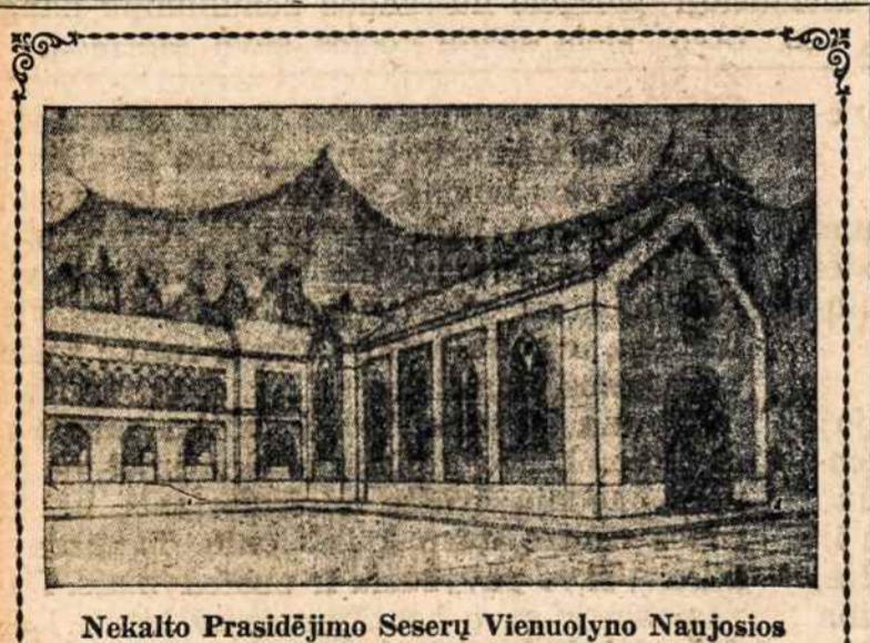
Nekalto Prasidėjimo Seserų Vieniolyno Naujosios Koplyčios Projektas

Paprašykite Jūsų Fordo Dylerį Pavažinėti '49 ir Užsisakykite šiandien