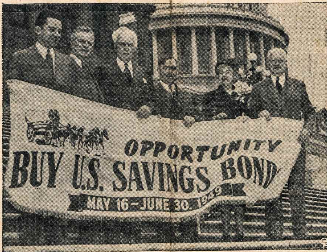
Grupė Kongrese respublikonų, nutraukta prie Kapitoliaus laiptų, kuri remia $1,040,000,000 bonų pardavimą. Iš kairės: atst. John Byrnes, Wisc.; W. Sterling Cole, N. Y.; Charles Eaton, N. J.; Joseph W. Martin, Jr. Mass.; Edith Nourse Rogers, Mass.; James C. Auchinloss, N. J.