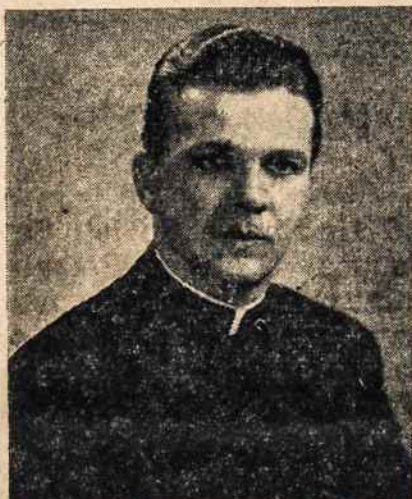
Naujas Dvasios Vadas