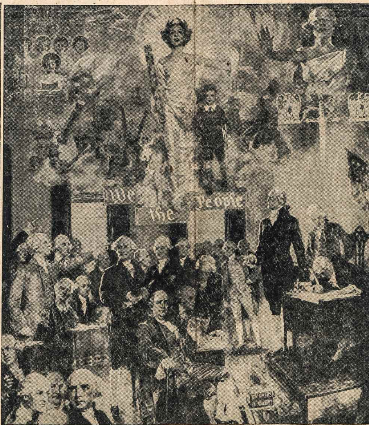
Liepos 4 d. Jungtinių Amerikos Valstybių nepriklausomybės šventė. Šis vaizdas vaizduoja nepriklausomybės paskelbimo įvykį prieš 173 metus, Philadelphia, Pa. Liepos 4 d. Kongresas formaliai priėmė Deklaraciją, oficialiai pavadintą "The Unanimous Declaration of the Thirteen United States of America."

Kaip matome, Kremliaus mašina reikiama užsukta ir ji be jokio pasigailėjimo traukia savo priešus, kankina ir žudo nekaltus žmones, brutališkiausiu būdu persekioja religinę laisvę, o Vakarai — vis dar tyli... Pr. Al