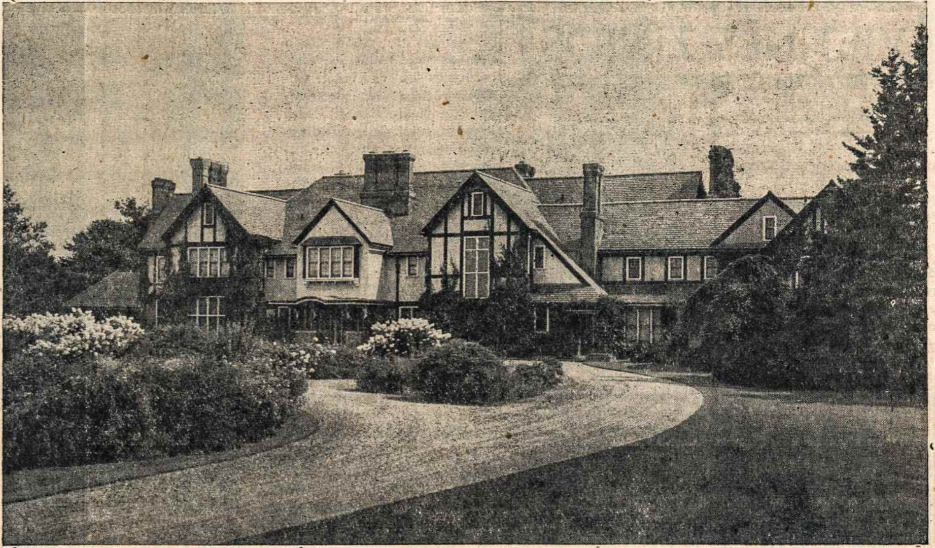
Lietuvos Pranciškonų Šv. Antano Vienuolynas, Kennebunk Port, Maine. Šio vienuolyno parke ir visame kieme rugpiūčio 14 d., š. m. įvyksta Lietuvių Diena, su iškilmingomis rytinėmis pamaldomis — Šv. Mišiomis — ir turininga popietine programa.

Šiomet Lietuvių Dienos pelnas bus skirstomas į tris dalis: viena Seselėms Kazimierietėms; antra Seselėms Pranciškietėms