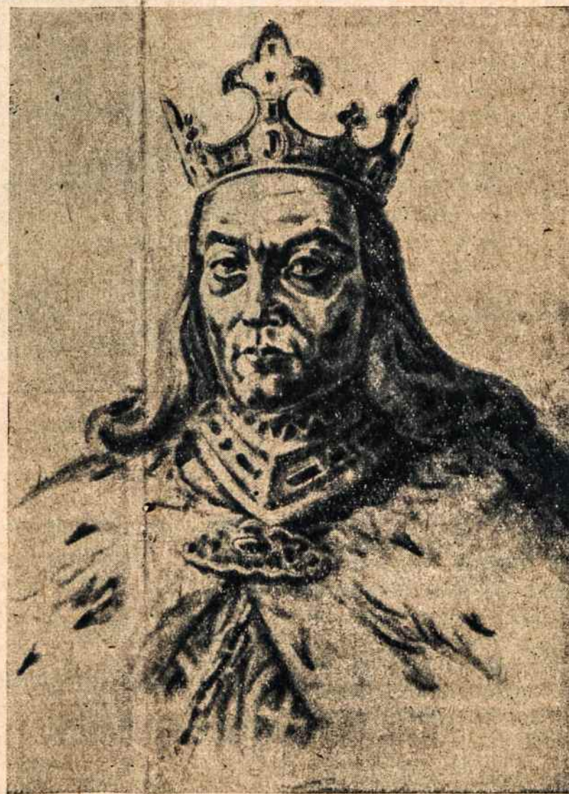
DIDYSIS LIETUVOS KUNIGAİKŠTIS VYTAUTAS