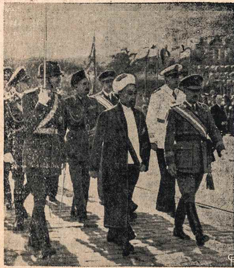
Transjordanijos valdovas, karalius Abdullah žygiuoja greta Ispanijos generalissimo Franko, lydimi garbės sargybos. Abdullah yra pirmas valstybės galva, kuris aplanko Franko po jo valdžios paėmimo Ispanijoje.