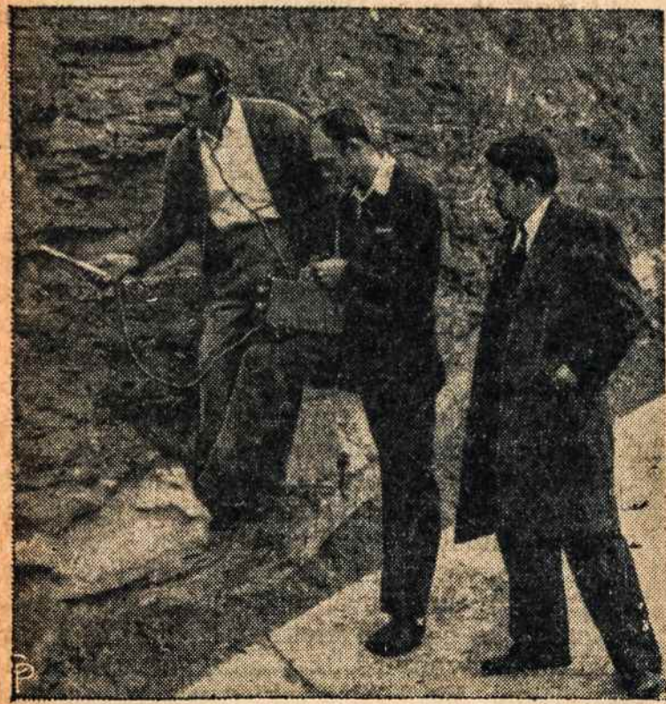
U. S. inžinieriai, pasinaudodami radio aktyvumui registruoti aparatais, ieško prie William Penn kelio, netoli Pittsburgh, Pa. uranijaus.