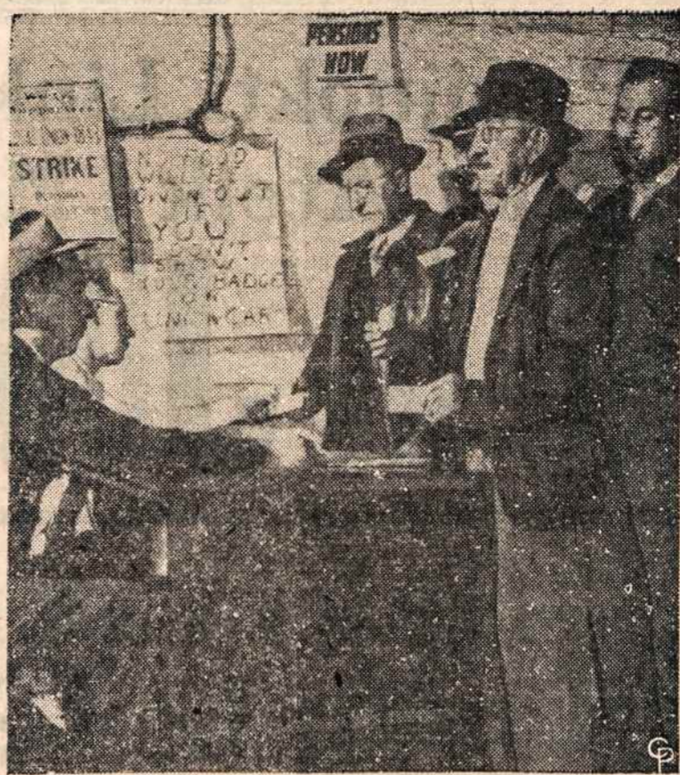
Plieno pramonės streikuojantieji darbininkai Pittsburghe unijos būsinėje reikalauja maistui pašalpos. Jiems išduodama po 2 dol. į dieną maistui, kuriuos matome čia asmeniškai atsiimant.

Tačiau tie argumentai nėra nauji. Juos randame jau šv. Rašte. Ir anais laikais negailėta pikčiausių kaltinimų apaštalam, net pačiam Kristui. Istorią gi nuolat kartojasi.