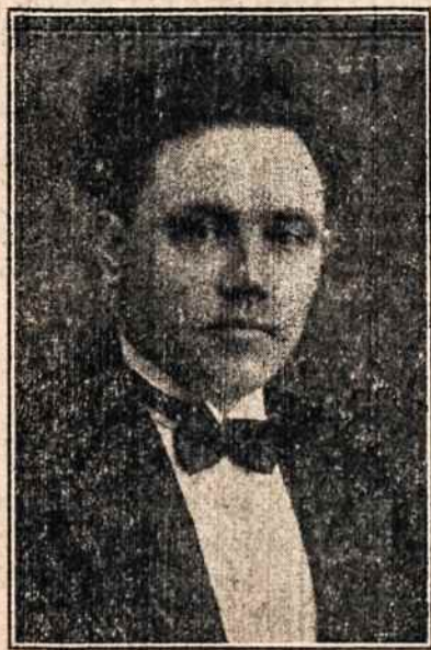
Muz. J. Tamulionis