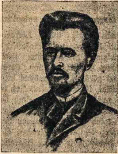
Dr. Vincas Kudirka

Už savo gyvybę be galo sunkiai kovojanti lietuvių tauta šiais metais mini 50 metų nuo mirties vieno pačių didžiųjų savo vyrų — dr. Vinco Kudirkos. Tai didysis kovotojas prieš rusų valdžią anais caristiniais laikais, tai didysis mūsų tautos žadintojas, laisvės ir demokratijos skelbėjas, nenuilstamas plunksnos darbininkas, didis rašytojas, Lietuvos himno autorius.