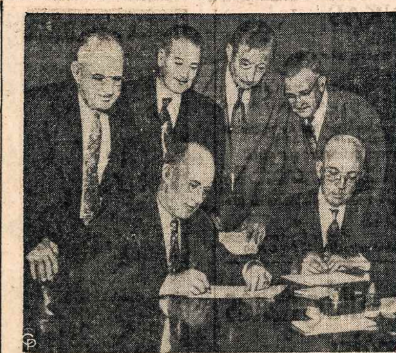
Unijos pareigūnai ir Missouri Pacific Railroad geležinkelio atstovai St. Louis mieste pasirašo susitarimą baigti 45 dienų "Mo Pac" streiką. Šio susitarimo pasekoje daugiau, kai 5,000 darbininkų grįžta darban.