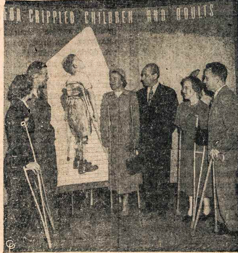
Grupė Amerikos vyrų ir moterų, kurie gerai supranta, kad jų gerovė ir kitų labai daug priklauso, nežiūrint fizinio trūkumų, ir nuo jų darbo. Jie yra dalyviai metinio suvažiavimo National Society for Crippled Children and Adults, New Yorke. Jų tarpe yra: rašytojai, laikraščiu leidėjai, ir p. p.

"Schule der Diktatoren" ("Europa" leidykla Zurich) pirmu pažvelgimu atrodo esąs lygiai toks pat pesimistiškas ir kritiškas kairiųjų partijų atžvilgiu, kaip Voigtas, savo knygoje "Uno Caesar", bet italo knygos pagrinde yra visai kitokia pasaulėžiūra. Nusveria tai, kad tiek socialistas, tiek komunistas — ir tai ypatinai tinka dėl pasaulėžiūros skirtumo atsiskyrimui nuo savo partijos — tiki "rojaus žemėje" galimumu. Pagaliau, socializmas yra optimistinė doktrina. Koestleris, Gide ir kitų jausminis motyvas yra ne paprastas nusivylimas tuo, kad lauktas rojus nepakankamai greitai tapo tikrove, bet greičiau baimė, kad pirmieji socialistinio sąjūdžio idealai bus aptemdėti. Socialistui nebūtina tikėti, kad žmonių bendruomenė tikrai pasieks tobulumo laipsnį. Bet beveik kiekvienas socialistas tiki, kad ji gali būti žymiai geresnė, kaip dabar kad yra, ir kad blogis didžiajai daliai yra neteisėtumas ir nelygybės padaras. Socializmo pagrindu yra komunizmas. Ortodoksinis socializmas yra nustojęs mesianiškojo (pasiuntininko) charakterio, jį dar tebeturėto prieš 30 metų, tai paaiškinama didėjančiu industrinio (pamoninio) gyvenimo komplikotumu, dienos reikalavimais, kovojant su fašizmu ir su Sovietų Rusijos pavyzdžiu. Norėdami likti valdžioje, komunistai buvo priversti bent laikinai apleisti keletą tų idejų, kurie pradžioje jiems buvo prieš akis. Nesąlygota ekonominė lygybė praktikoje pasirodė negalima; internacionalumą sunaikino kapitalistinių pajėgų priešingasis nusistatymas.