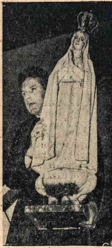
Fatimos Dievo Motinos stovykla, atvežta iš Lisbonos į Romą dviejų dienų pagerbimui iš orlaivio nešama į bažnyčia. Po to ji keliaus į Indiją, Australiją ir Zelandiją.

vistiek) T. Rusijai. Tad mes tą savo laikraštį skaitome, o ji mus informuoja. Bet dažnas skaito ir numetame. Kas gi būtų buvę, jei, sakysime,