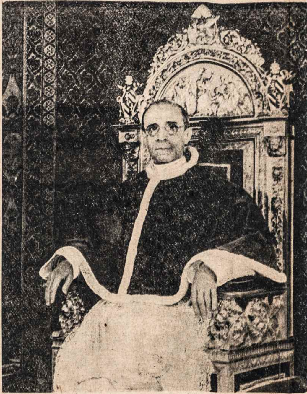
Jo šventenybė Popiežius Pijus XII

Pažymėtina, kad šio nacių kariškio byla buvo įgavusi specialų pobūdį, nes byloje, kaip jau minėjome, davė savus patarimus 2-rame pusl.