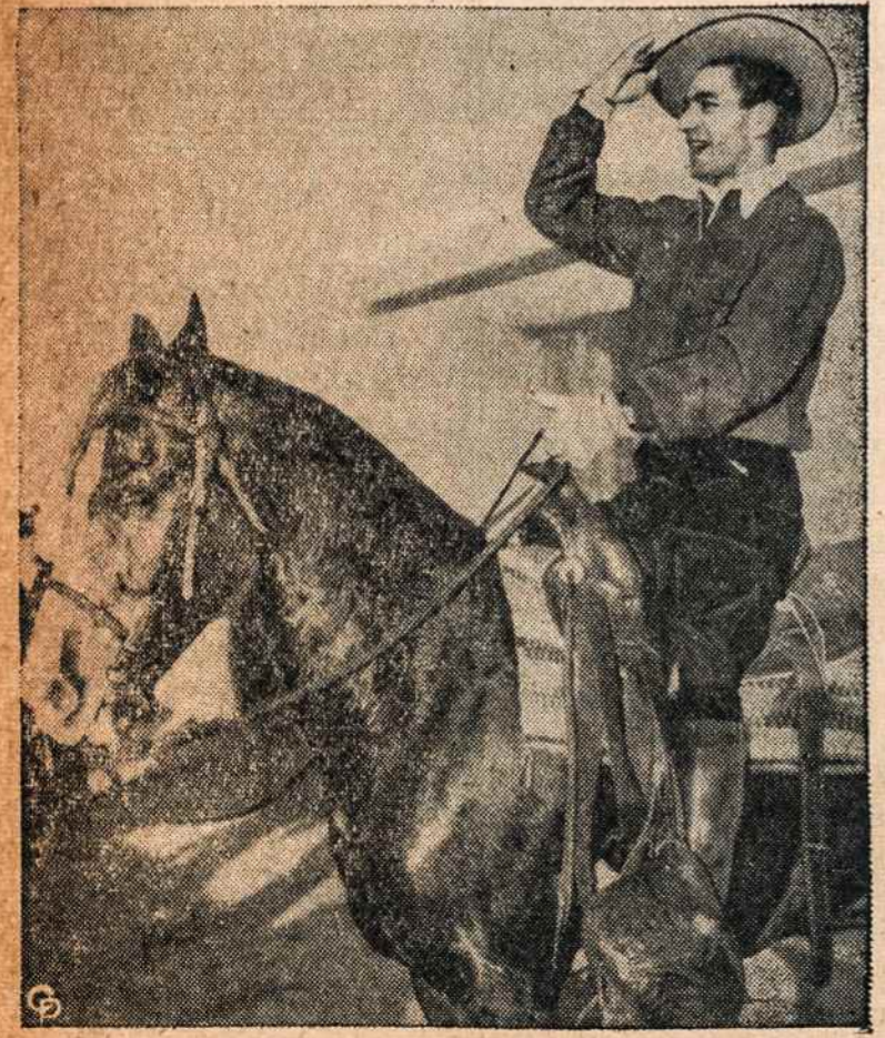
Irano šachas Mohammed Reza Pahleva, atvažduotas apžiūrint Phoenix, Arizona, valstijoje...