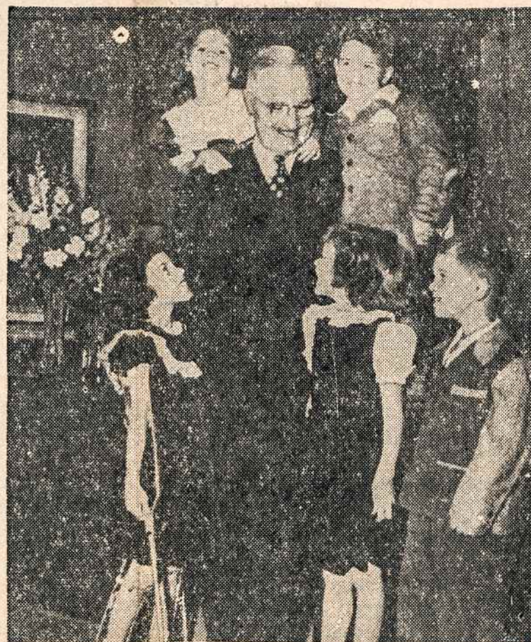
Prezidentas Trumanas, apsuptas sergančiųjų "polio" liga vaikų Baltuose Rūmuose, pradeda "Dešimtukų Vajaus" (March of Dimes) 1950 m. kompaniją.