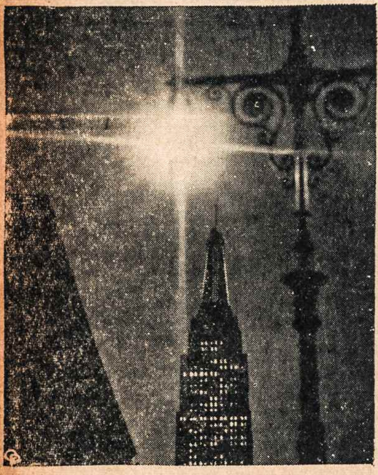
Empire State Building New Yorke, apšviestas įvairių spalvų elektros lempučių šviesos spinduliais Kalėdų švenčių proga, atrodė lyg milžiniška Kalėdų eglutė, kurios šviesų refleksija ore sudarė didžiulį kryžį.

DARBININKAS 366 W. Broadway So. Boston 27, Mass.