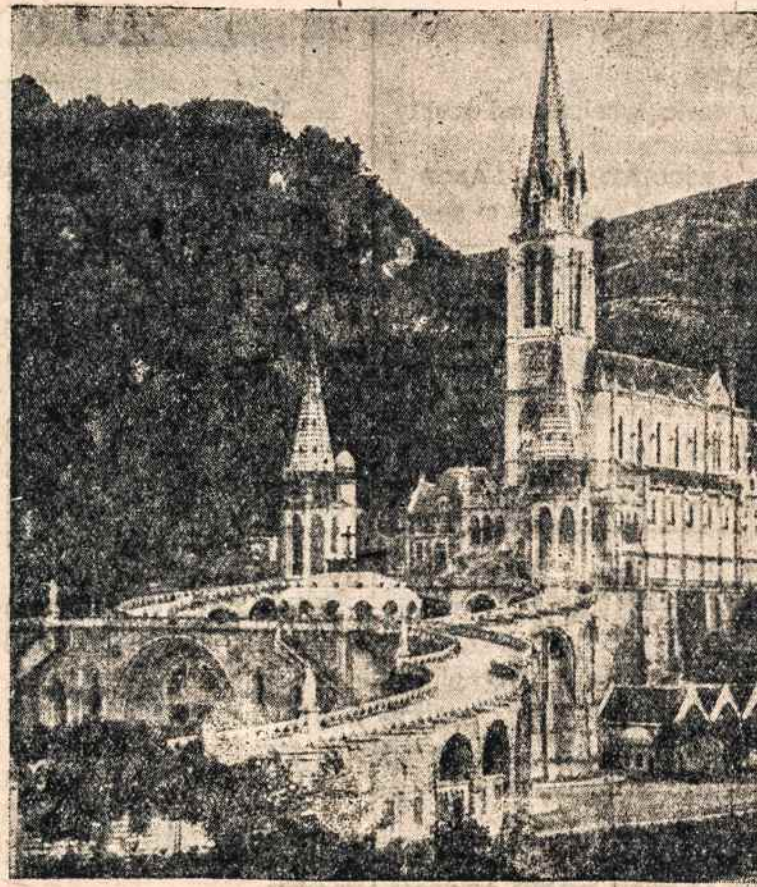
Liuordo šventovė dabar