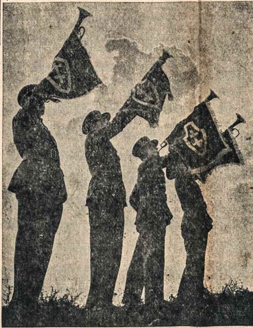
Lietuvos kariai laisvės metu