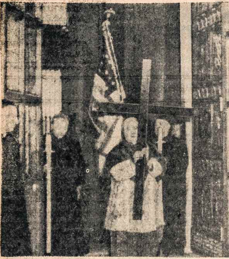
Kard. Francis Spellman su kryžiumi įžengia į šv. Petro Baziliką Romoje. Audiencijoje Vatikane pas Pijų XII.