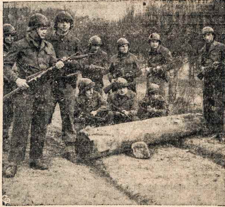
Prancūzų apsaugos daliniai iš darbininkų pasirošę Paržiaus gatvėse atstatyti viešąją tvarką, kurią komunistai kėsinosi ardyti.

Nuosirdžiai dėkojamė už paramą. "Darbininko" Administracija.