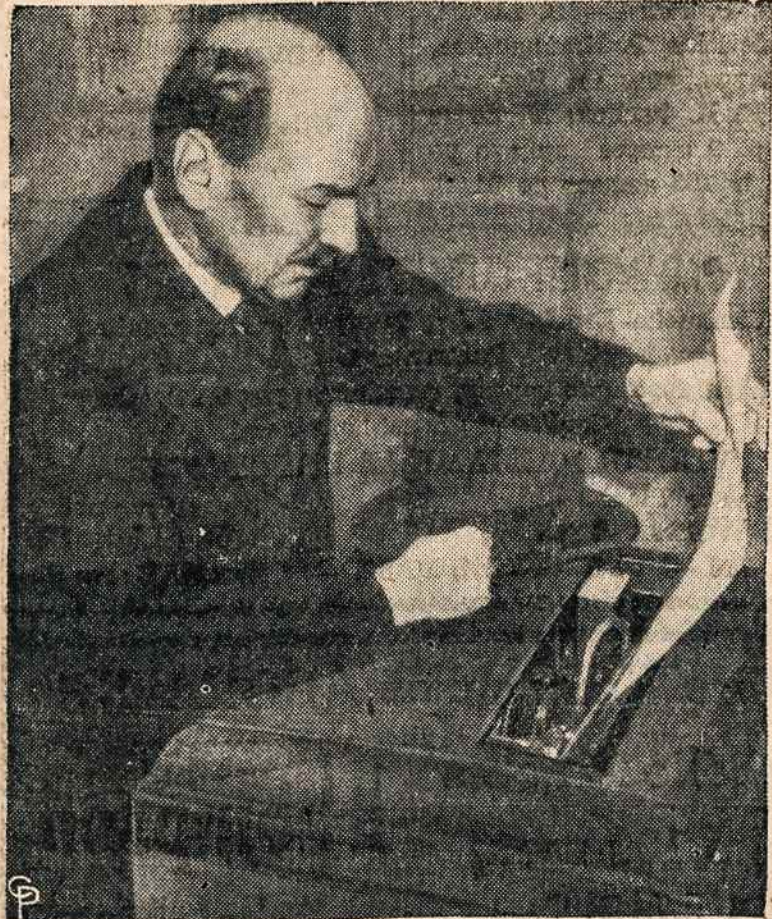
Darbiečių vadas Atlee parlamente laimėjo pasitikėjimą jau trečią kartą.