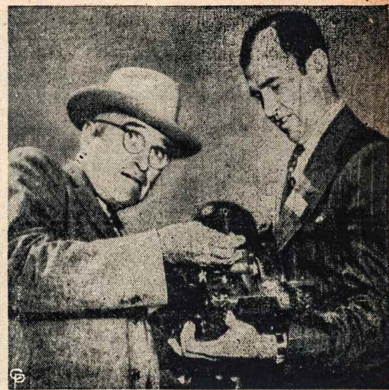
PREZIDENTAS HARRY TRUMAN dalyvavo kariuomenės manevruose Fort Bening, Ga. Armijos sekretorius Frank Pace rodo prezidentui naują tanko modelį.

Sąryšyje su šia akcija prezidentas pabrėžė, kad vyriausybė nesirengia FBI paversti geštapo organizacija, per kurią