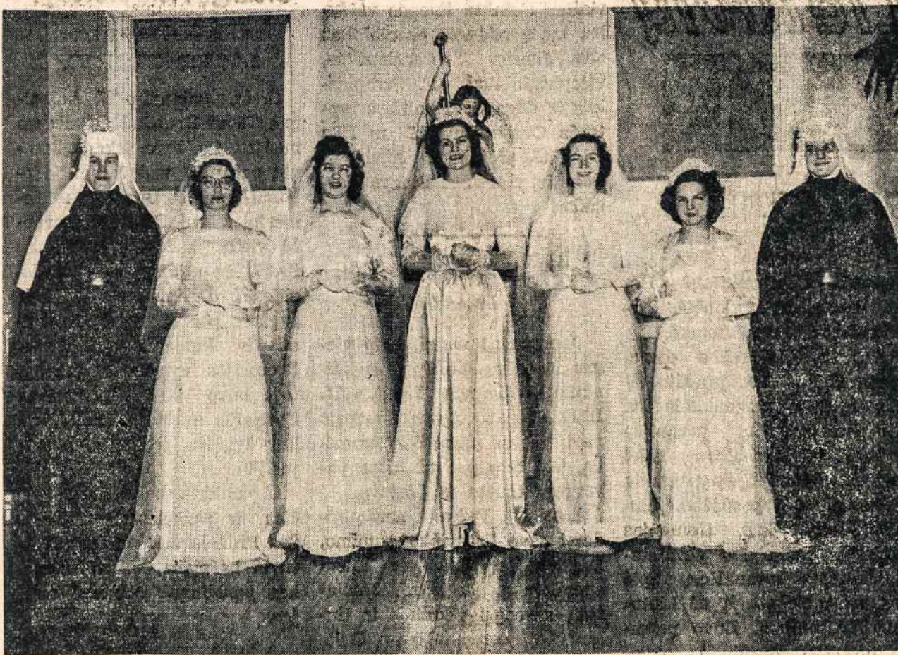
Jėzaus Nukryžiuotojo kongregacijos seserys, pasirengusios įvilktuvių ir įžadų šventei, kuri įvyks š. m. balandžio mėn 11 d. Dabar jos laukia jubiliejinio seimelio š. m. birželio mėn 18 d.

Išpūdingas buvęs ir jubiliejinis bazilikų lankymas. Čia pajuntama nepertraukiamas dabarties ryšis su garbingąja praeimi. Romoje gyvai prisistato visas krikščionybės neuitas kelias, pradant nuo kankinių krauju aplaistytos kolozėjaus arenos, einant per jų kapus mistiškuose katakombų požemiuose, susimąstant prie Konstantino Didžiojo statytosios bazilikos griuvėsių, žvelgiant į amžių bėgyje iškilusius didingus krikščionybės paminklus. Suklupus šimtatūkstantinėje tarptautinėje brolių minioje priimti šv.