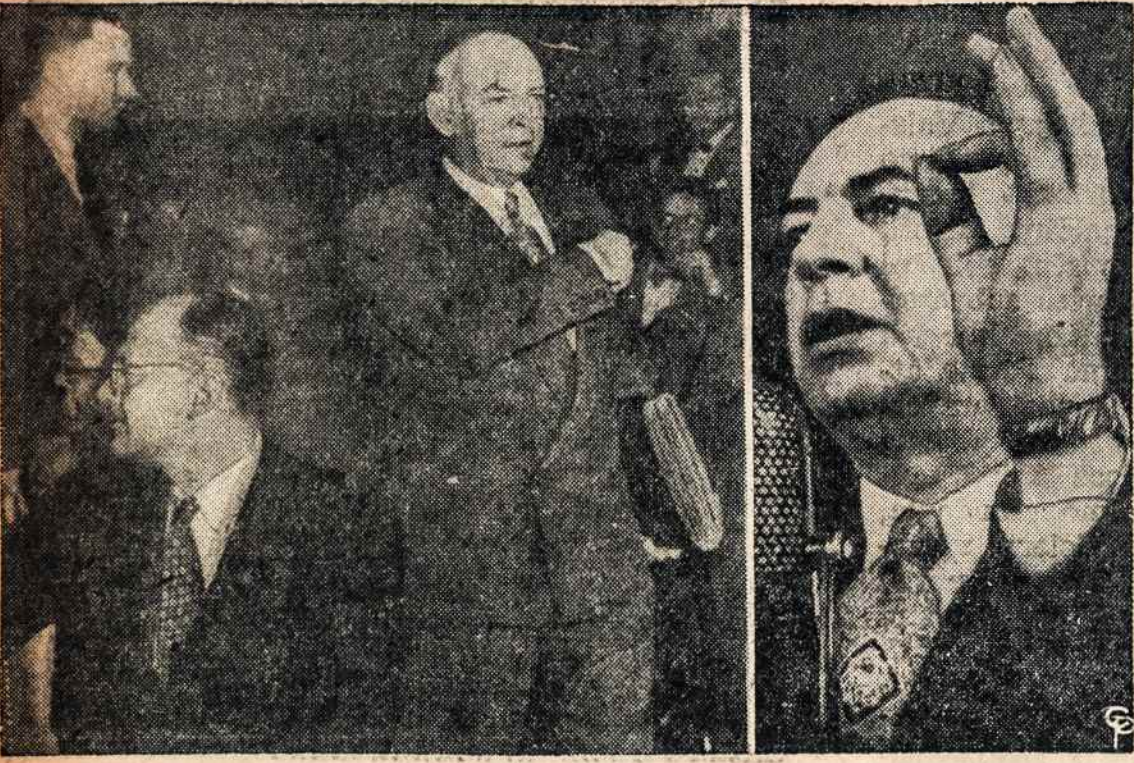
LOUIS BUDENZ IR OWEN LATTIMORE