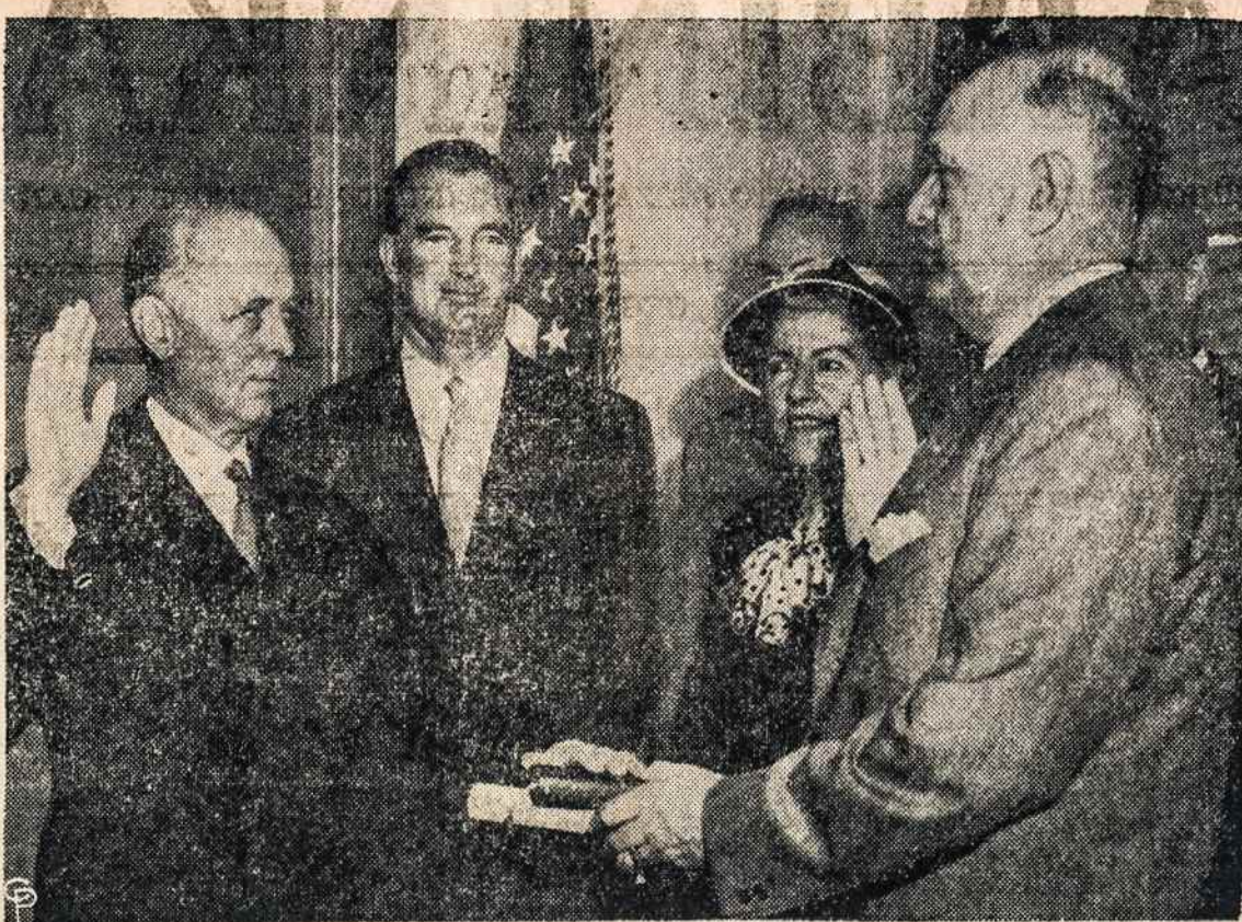
THOMAS K. FINLETTER,

naujas orinių pajėgų sekretorius (kairėje) prisiekia eiti ištikimai savo pareigas. Priesaiką priima gynybos sekretorius Louis Johnson (dešinėje). Viduryje pasitraukęs pirmą kartą sekretorius W. Stuart Symington.