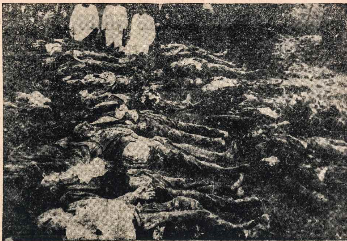
Panevėžio cukraus fabriko darbininkai, b olševikų išžudyti 1941 m. birželio mėn. 26 d.

mi Lietuvos kryžiaus kelią, kuriuo ji grįžta atgal į nepriklausomybę. Nuo pat okupacijos pradžios tauta parodė didelį dvasios atsparumą visam, kas sovietiška, komunistiška, rusiška. Lietuvių širdys priešui neprieinama. Jos yra svarbiausias pagrindis, kuriame tauta išsaugos savo nepakeičiamą galutinę valią atstatyti savo seną garbingą valstybę.