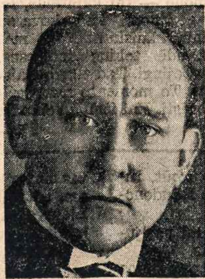
Dr. Leonas Bistras, buvęs Lietuvos ministeris pirmininkas, suimtas vienas iš pirmųjų ir išvežtas į Rusiją.