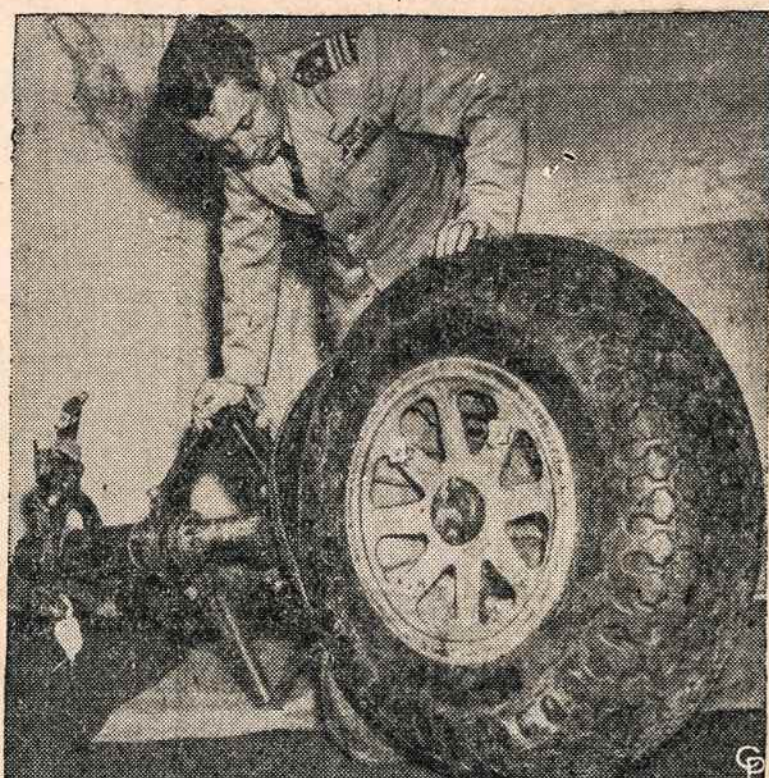
Washingtonė tiriamas rastas Baltijos jūroje ratas, kuris priklausė bolševikų nušautam lėktuvui.