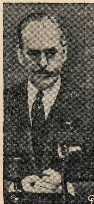
Valstybės Sekretorius Dean Acheson kalba Kongresui apie Londono konferenciją. 7-M—

"Lietuva, tėvyne mano, tu esi kaip sveikata, tik tas gali tą gerai suprasti, kas tavęs neteko. A. Mickevičius.