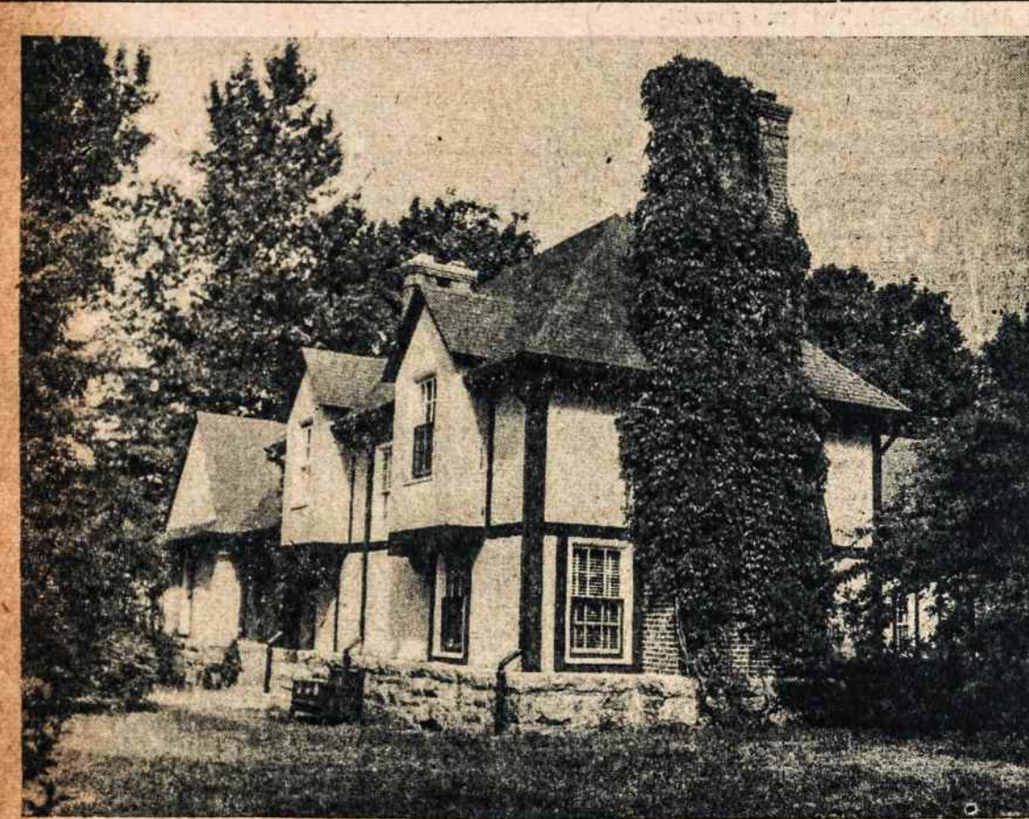
Tėvų Pranciškonų naujai atidaroma šv. Antano vardo stovykla, kurioje šiais metais atostogaus 40 lietuvių berniukų.