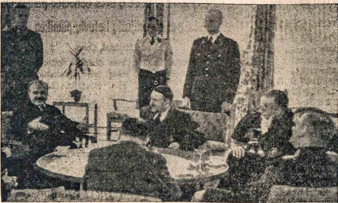
Molotovas su Ribentropu pasirašo karinio nepuolimo sutartį. Šia sutartimi Lietuva buvo parduota Sovietų Rusijai. Ribentropas po karo pakartas, o Molotovas dar laukia savo eilės.