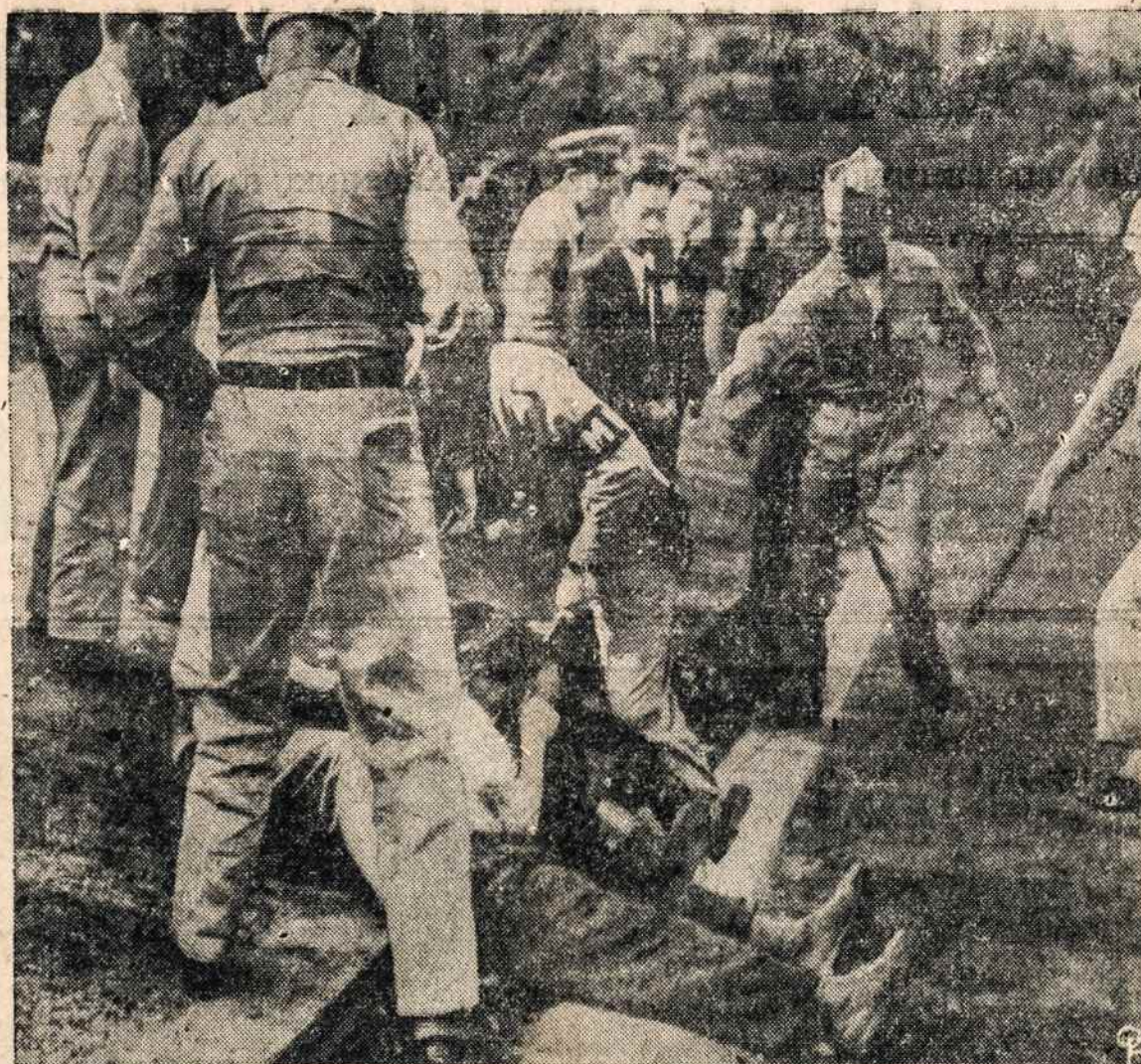
JAV kariai sklaido demonstruojančius komunistus Karališkoje aikštėje, Toky, Japonija. Aštuoni trukmadariai areštuoti ir perduoti teismui.

— Pagal sovietų masinio naikinimo techniką Lietuvoje, kaip ir kitose rytu Europos valstybėse, tuščia erdvė yra kolonizuojama ateiviais iš tolimųjų Rytų. Šiuo nauju tautų kilnojamu Sovietų Sąjunga pastūmė į Vakarus ne tik politines, karines ir ideologines sienas,