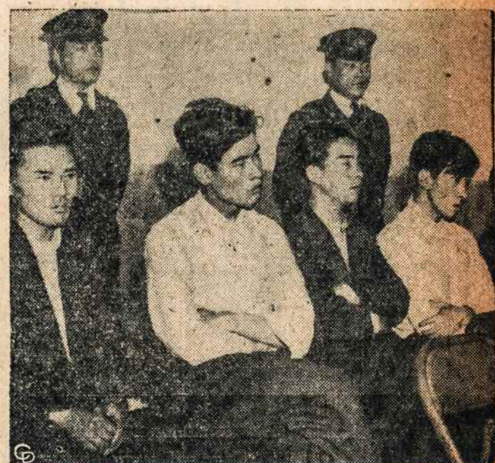
Japonijos komunistai, kėlę triukšmą ir muštynes Mirusiųjų dieną, patraukti į teismą.

Iš pavergtos Lietuvos laiško užsienio lietuviams. 1947 m.