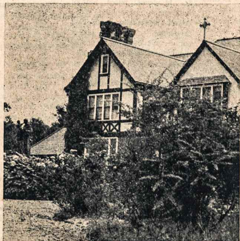
ŠV. ANTANO VIENUOLYNAS IR KOPLYČIA