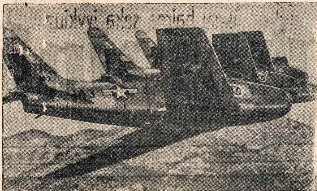
F-86 Sabre — greičiausias pasaulyje sprausminiai lėktuvai viršum Korėjos.