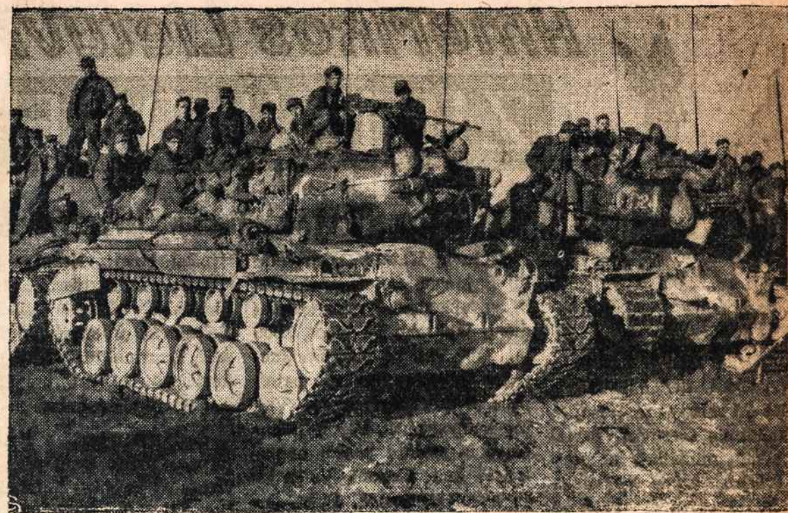
Paskutiniai JAV tankai pasirengę palikti Hungnam uostą. Jie čia dar nukreipti į besiveržiantį priešą. Šaudymui aptilus, kariai naudojami trumpa pertrauka.