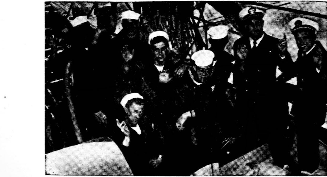
Naikintojo "Rodman" jūrininkų grupė pavyzdinai atlikusi beskestančio naikintojo "Hobson" igulos gelbėjimo darbą, kai pastarasis susidūrė Saurės Atlante manevrų metu su iškutvėsiu "Wasp", laimingai grįžo į New Yorką.

Per balandžio mėn. Balfo centre gauta 2329,46 dol. aukų ir 95 dol. nario mok. Rūbų gauta 2825 svarai.