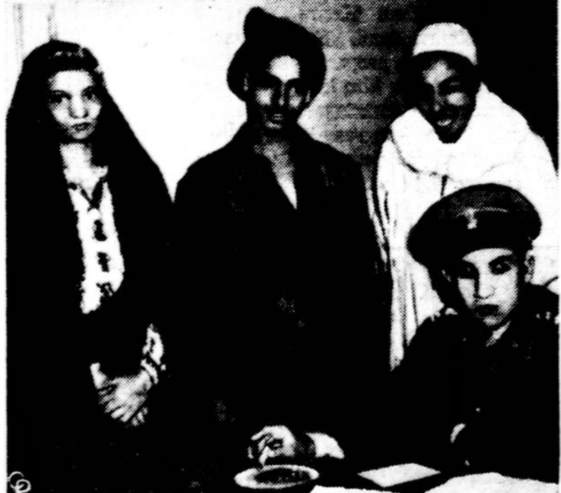
Paprastai kyla nesupratimų, jei nuotaka pasirodo vyresnė, negu jauniamam buvo sakoma. Tačiau kartais atsitinka ir priešingai. Ap- tinkami pavyksė du egiptiečiai, apskunde salia jų stovintia moterį, kad ji norėjo juos pagauti, tvirtindama, jog turinti dvi pasirodusias tekėti apie 20 metų dukteris. Bet kai salia jos stovintis arabas (žino- ma, sumokėjęs sutartą mokesči) pasigėženo nuotaka jau namo, pa- matė, kad ji vos devynerių metų. Antroji dukterė buvo vos septynerių metų. Jaunikiai pasijuto apgauti, ir byla atsidūrė teisme.