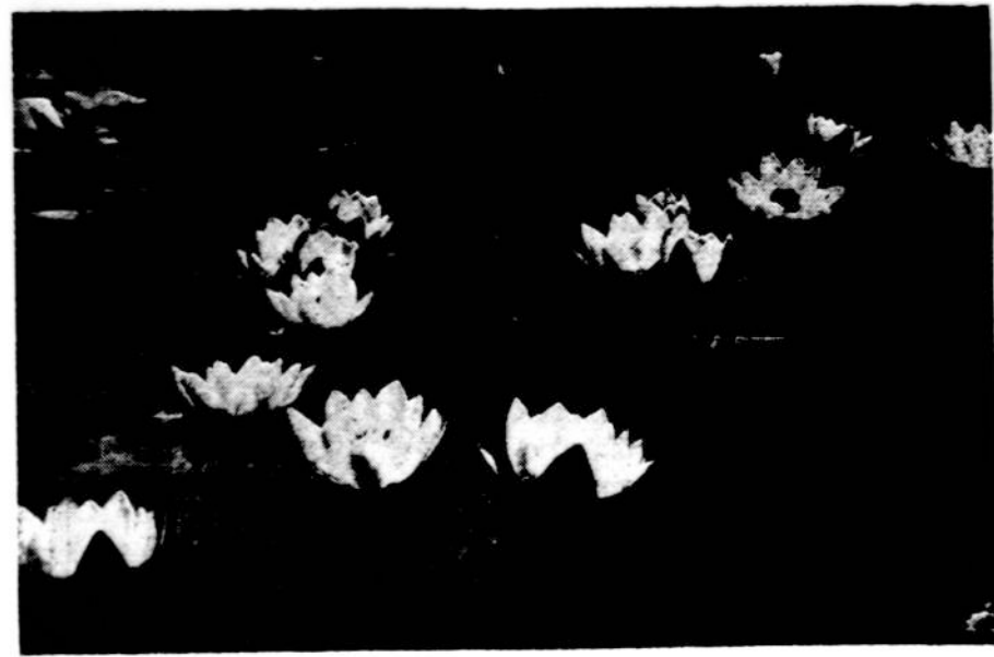
Pavasaris praskleidē baltuosius vandens lelijū žiedus.

Vokietijoje, Braunschweigo provincijoje, prie Leberstedto miesto buvo daromi žemēs gręžiniai sulniui iškasti. Keturiū metrū žemēs gilumoje užtikta mamuto bei arkljo kaulū ir žmogaus įrankiū iš a Tyrinėjimai rodo, kad ē gauts gyventa dar 200,000 prieš Kristū.