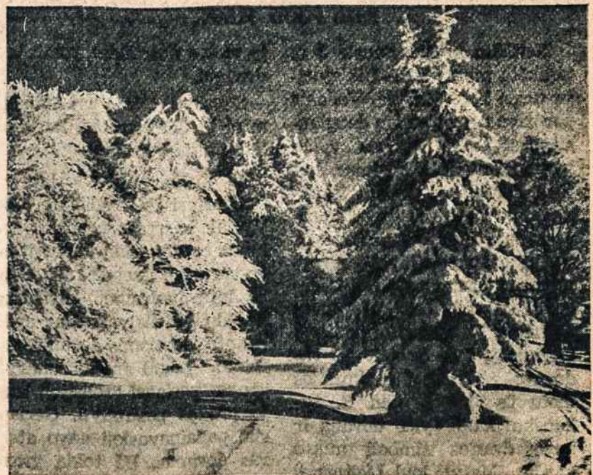
...užpustė takus takelius

Kitą dieną man praneša, jog moterėlės nusprendė lignonį vežti ligcinėn. Keliant į vežimą, lignonis apsiplė kraujais ir mirė.