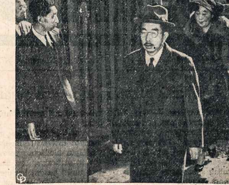
Japonijos imperatorius Hirohito su žmona Nagato atvyksta į savo brolio Kugenuma laidotuves. Brolis mirė džiova. Dar vienas, jauniausias brolis Takamatsu, čia matomas kairėje. Jų buvo iš viso trys broliai.

apskundė savo sūnų vyriausiam žydų rabinui Ekaterinoslave. Tėvas kaltino prieš rabinų teismą savo sūnų, kad „jis išsižadėjęs tėvų tikėjimo, patapęs žydų priešu ir žmonijos rykšte.“ Toliau jis susijaudinęs pareiškė: „Aš noriu, kad mano sūnus būtų prakeiktas amžinai, kad jį palieštų toks prakeikimas, kuris nuo pasaulio pradžios ištariamasis tik Dievo priešams ir nuo kurio nėra atpirkimo nei ant žemės, nei danguje, nei pragare.“ Vyriausiasis rabinas po to atkabėjo septynias ritualines maldas, paskui ištare septynis kartus prakeikimo žodžius ir užpūtė septynias žvakes. Trockio motina, kuri čia pat buvo, sukniubo ir apalpo. Jos sūnus tada buvo karo ir laivyno komisaras. Po aštuonerių metų ji prakeikimas jau palietė: Stalinas išvyko iš valdžios ir paskui pavijo Meksikoje.