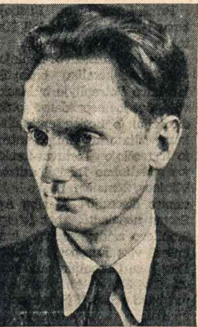
Kompozitorius Jeronimas Kačinskas

J. Kačinskio kūrinys savo melodingumu yra grynai bažnytinėje dvasioje. Vaizduojamasis teksto turinys yra prog-