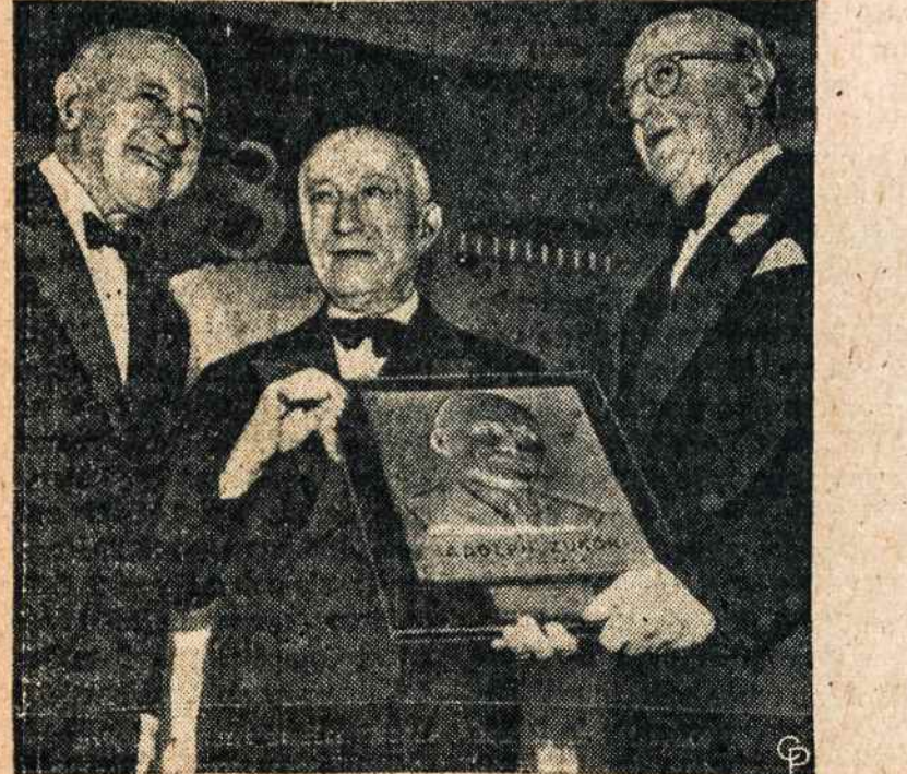
Filmu gamintojas Hollywoodo Adolf Zukor atšventė 80 metų amžiaus ir 50 metų savo filminio triūso sukaktis. Jis gavo dovana — savo paties bareljefą. Iš abiejų pusių stovi kiti du senyvi filmu gamintojai: kairėje Cecil B. DeMille ir dešinėje Jesse L. Lasky.

Francūzų filmas Les jeux interdits (Forbidden Games) laimėjo geriausio svetima kalba filmo titulą, antroje vietoje palikęs italių The White Line ir Two Cents Worth of Hope.