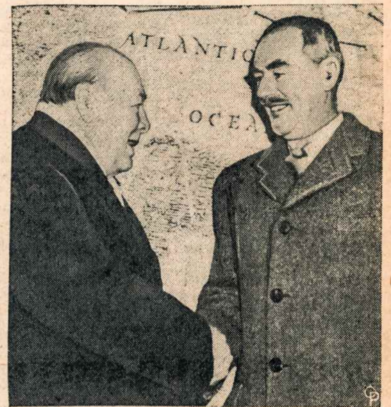
Winston Churchill sveikina su Valstybės sekretorium Dea Acheson. Žemėlapis rodo, kokie vandenys skiria Angliją ir Ameriką. Perplaukti juos lengviau negu politikai suderinti. W. Churchill po pasitarimų išvyko atostogų į Jamaiką.

Sausio 10 sąjungininkų 300 lėštuvų bombardavo tiltus, karavines prie Yalu upės.