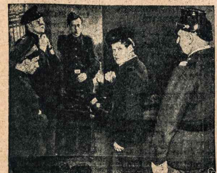
Keturi vokiečių jaunuoliai, bolševikų mobilizuoti ir įjungti į Sovietų zonos policiją, pabėgo į Berlyno vakariečių zoną. Per 1952 metus jų pabėgo 2.249. Čia jie nusimeta sovietiška uniformą.

Buvęs Lietuvos Universiteto Profesorius, Ministeris Lietu- vos Vyriausybės, kuri vadova- vo 1941 sukilimui prieš Sovie- tų okupaciją.