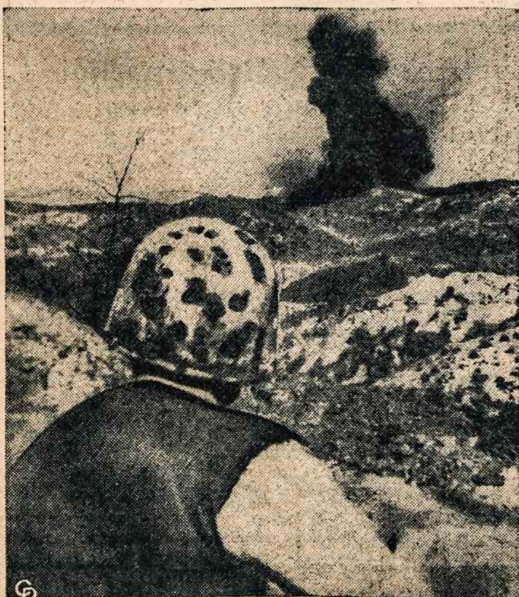
JAV aviacija sprogdina priešų pozicijas kalnuose