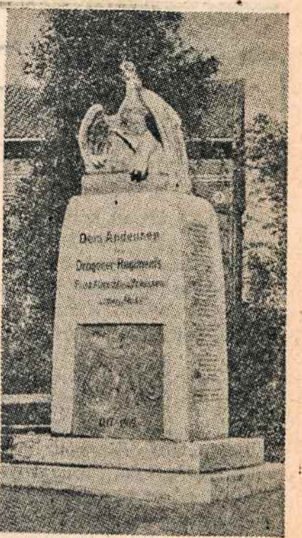
Paminklas, pastatytas Tilžėje lietuviams kariams, kurie suadrė atskira dragunų pulka Princeso Alberto kariuomenėje, Prūsijoje.

Mes, Mažosios Lietuvos lietuvių atstovai, turėdami galvoje aukščiausiai suminėmus faktus, pasirėmę Atlanto Chartos