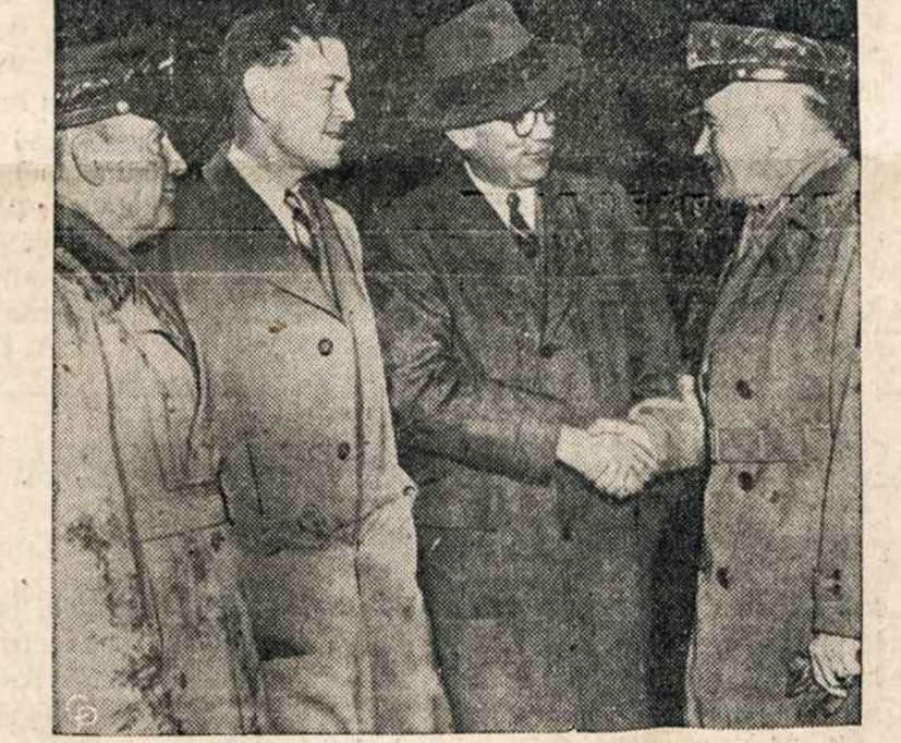
JAV ARMIJOS štabo viršininkas gen. J. Lawton išvyko į Korėją. Čia matome jį prieš pat išvykimą aerodrome, palydima aukštu kariūninku.

— Nepaskutinės reikšmės turėjo politinių komisarų įtaka kariuomenėje, kuri sugaišindavo kariuomenės veiksmus, paraližudavo atsakomybę ir iniciatyvą. Politinis 1935 m. valymas stipriai atsiliepė specialistų trūkumui. Tačiau komisarai palaikė kariuomenėje discipliną, kuri pirmomis karo dienomis po nenusisekusių puolimų visai pairo. Komisarai varė kariuomenę pulti, o apsuptiems daliniams, varginamiems alio ir šalčio, neleido pasiduoti, grasindami represijomis šei-