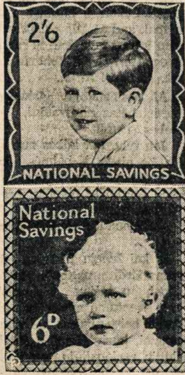
ANGLIJOS SOSTO IPEDINIAI, princas Charles ir princesė Anne, atmušti ant ženkliuko, kurie naudojami taupymui lėšų, ryšium su artėjančiomis karalienės Elizabeth II karūnacijos iškilimams.

Vienas iš didžiausių jo darbų yra didelis, gerai dokumentuo-