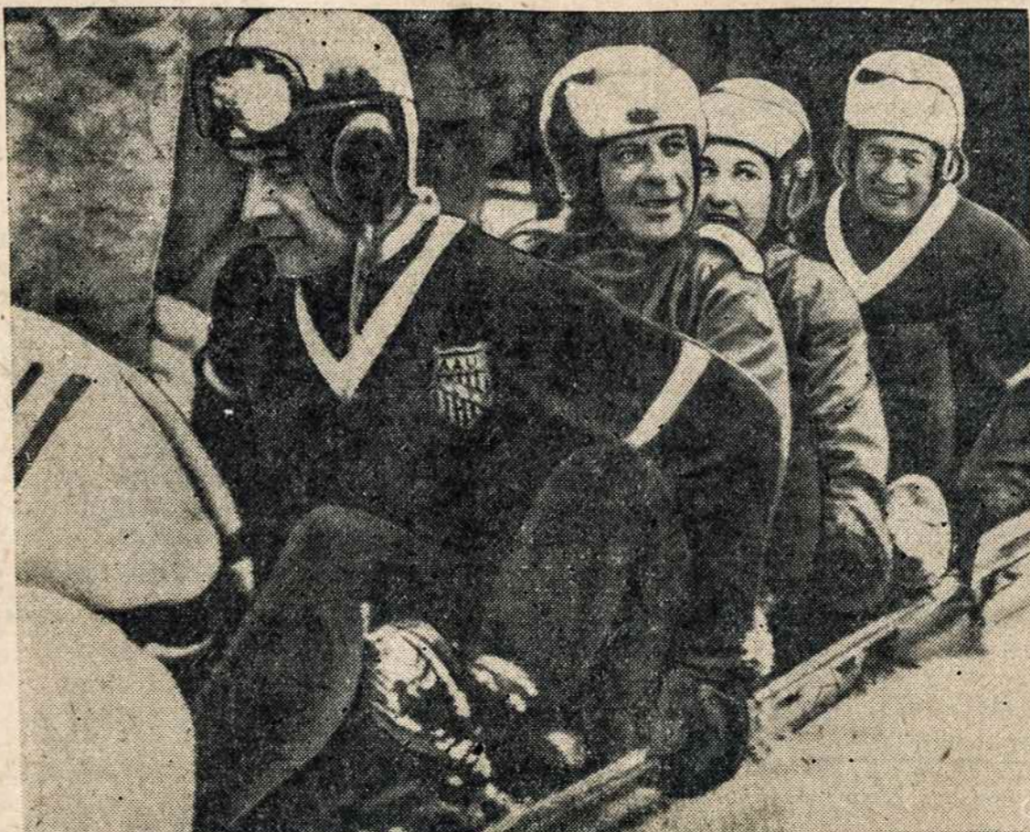
GEN. MATTHEW B. RIDGWAY su žmoais ir dviem karininkais leidžiasi rogutėmis nuo pa-ojino skardžio Alpių kalnuose (Volcietijoje, Garmish), kur vyks pasaulinė žiemos sporto olimpiada. Joje dalyvauja ir amerikiečių komanda (American bob sled team).

Vis tai dėjos netoli Sovietų valdomų sričių.