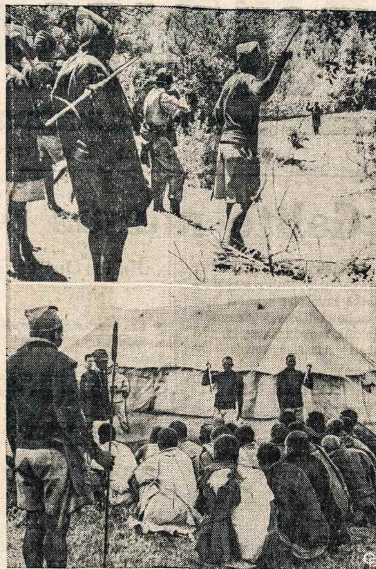
MAU MAU GAUDOMI IR SAUDOMI. Kenijoje, Afrikoje, veikia teroristinė Mau Mau organizacija, žudanti baltuosius ir krikščionis. Ji skelbiasi kovojanti už Afrikos laisvę, bet jos metodai artimi komunistų taktikai. Aukštai matome Afrikos juodukus ir britų karinius, kurie paėmė ir nelaisvę vieną Mau Mau partizaną. Apačioje — jų būrys, paimtas ir nelaisvę.