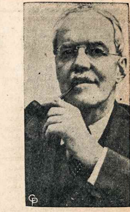
ALLEN DULLES, Valstybės Departamento sekretorius J. F. Dulles brolis, paskirtas vadovauti Central Intelligence Agency (CIA).

Rusų aviacija prieš karą buvo labai vertinama. Tačiau blogiausio laukiant baimė pasirodė: Naujų lėktuvų rusų aviacija neturėjo. Buvo vartojami daugiausia tos rūšies lėktuvai, kokie buvo siunčiami į Ispaniją. Žiema nesudarė sovietų lakūnams jokių sunkumų. Prie poliarinio klimato jie buvo pripatinti. Sausis ir vasaris buvo palankiausi jiems Suomijos miestus bombarduoti. Apie 2500 sovietų lėktuvų buvo šiame kare. Bet jie nebuvo taiklūs. Nepalaužė nei tautos atsparumo, nei kariuomenės tiekimo nesuardė. Buvo numesta 150.000 bombų, arba 7500 tonų. Užmušta 700 civilių gyventojų. Dvigubai sužeista. Bet prieš aviaciją. Suomijos nuo ryšių su užsieniais neatkirto. Nei vandens nei geležinkelų susisiekimo nesuar-