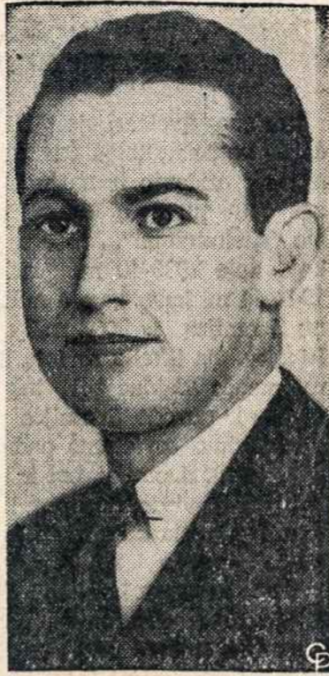
DR. JONAS E. SALK, direktorius medicinos mokyklos prie Pittsburgho universiteto, yra tiek jau pavarsęs į priešį tyrinėjimus polio ligos skiepiams sudaryti, kad tikimasi, jog rudenį galima bus juos plačiai taikyti žmonėms.

dos reikėsi įvairiose organizacijose. Jis buvo paminklinės Prisikėlimo bažnyčios vykdomojo komiteto reikalų vedėjas. Kaip šio darbo propagatorius jis 1937-38 m. lankėsi Amerikoje. Šiuo metu jis gyvena Urugvajuje.