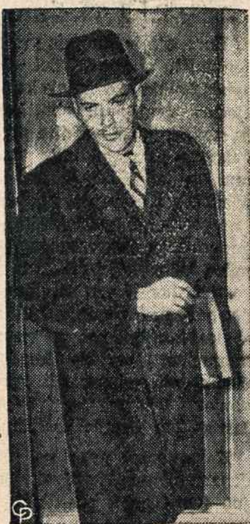
WILLIAM REMINGTON, buvęs Komercijos Departamento aukštas valdininkas, nebegali išsisteisinti, kad jis neturėjęs ryšių su komunistais ir nemelavęs po priesaiką. Jis gali gauti 5 metus kalėjimo ir 4000 dol. baudos.