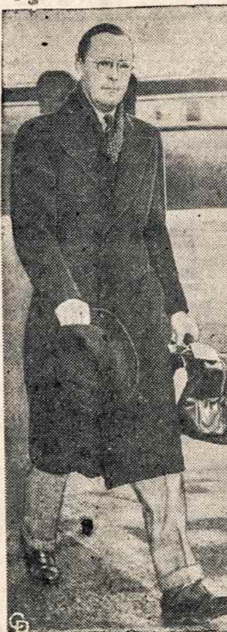
PRINCA BERNHARD, Olandijos karalienės Julijos vyras, dalyvaus New Yorko 300 metų sukakties iškilmėse, New Yorko miestui pradžia davė olandų kaimas Manhattan pusiasaly. Jis vadinosi New Amsterdam. Anglai 1664 m. jo vardą pakeitė į New Yorką.

Liet. Kat. Darbininkų Klubu susirinkimas šaukiamas vasario 13 d. 8 val. vak. Angelų Karalienės parap. salėje, So. 4th ir Roebing Sts. kamps. Visi klubo nariai kviečiami dalyvauti. Bus renkama valdyba ir aptarta šv. Kazimiero dienos minėjimo programa. Šv. Kazimiero dieną klubas yra numatęs minėti kovo 8 d. 5 val. vak. Angelų Karalienės parap. salėje.