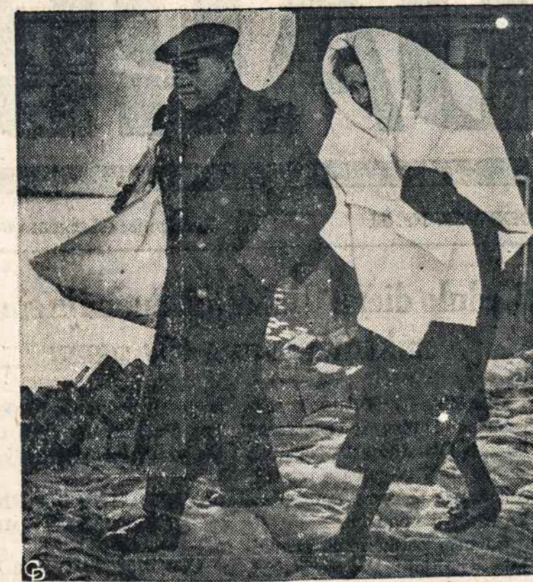
DU OLANDAI, vyras ir žmona, jūros potvyno užklupti, bėga, palikę namus ir visą savo turą.