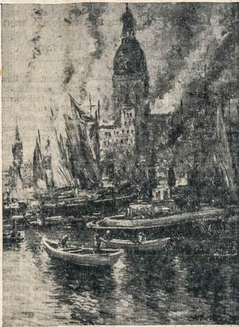
Ludolfs Liberts Ryga ūkanose