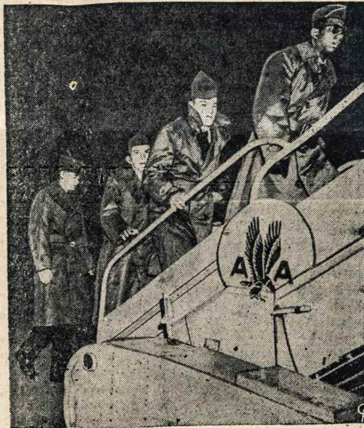
49 AWOL GRUPE vyksta į Tolinuosius Rytus.

dra draudžiamas išsisoms tautoms. Kenciančiai Tylos Bažnyčiai šiandien priklauso 3 milijonai vokiečių katalikų, 23 milijonai lenkų, 12 milijonų čekų ir slovakų, 6 milijonai vengrų, 5 milijonai ukrainiečių, 3 milijonai rumunų, 3 milijonai Pabaltijo valstybių katalikų, 100,000 Albanijos katalikų, 57,000 — Bulgarijos, 6 milijonai Jugoslavijos ir 4 milijonai Kinijos katalikų. Iš viso yra apie 100 vyskupijų, kur komunistai visomis priemonėmis stengiasi išnaikinti religiją, persekidami kunigus, niekindami bažnyčias, gąsdindami tikinčiuosius, o ypatinai gąsdindami jaunimą per savo mokyklas, kuriose mokoma atelzmo ir ištvirkimo... Tas persekiojimas paliečia kiekvieną kataliką ir kiekvieną garbingą pilietį, jis įžeidžia žmogaus širdyje įdiegtą moralę, jis sunaikinimu graso kiekvienai šeimai ir kiekvienai tautai..."