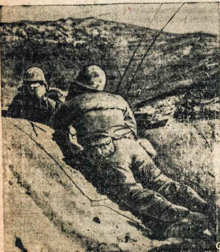
KARIAI ATAKOJE. Čia matome Jungtinių Tautų armijos du karis, kurie kalno atkūstumoje stebi ir pranešė apie artilerijos taliknius. Po smarkios ugnies buvo užimta Ungkok sustiprinta kalva. Užimta 350 priešių.

Tel. EV 2-9586 (Prie Forest Ave. stoties), Ridgewood