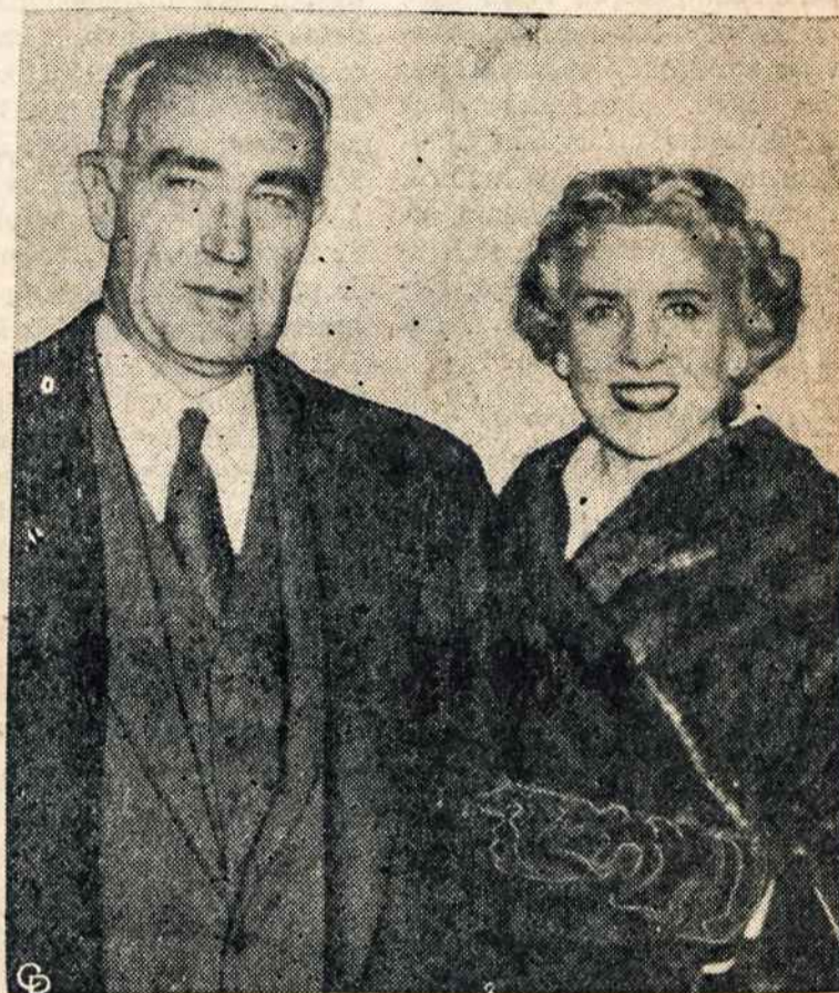
MRS. CLARE BOOTH LUCE, buvusi Kongreso atstovė iš Connecticut, prezidento D. Eisenhowerio skiriama JAV ambasadorė Italijai. Kairėje jos vyras — Mr. Henry Luce, žurnalių leidėjas. Mrs. Clare Booth Luce yra katalikė. Jos paskyrimą turės dar Senatas patvirtinti.

Iš tikrųjų pasmerktasis Bentley patsai nieko neužmušė. Bet jis su jaunesniu draugu, šešiolikamečiu, vieną naktį mėgino įsilaužti ir buvo policijos užklupti. Bentley jau buvo policijos rankose; policininkai stengėsi tik sučiupti jo jaunesnį draugą. Bentley draugui suriko: "Duok jiems". Jo draugas tada paleido šuvi ir vieną policininką nušovė. Šitas nepilnamečio kūrystymas teismo buvo rastas pakankama priežastimi Bentley skirti mirties