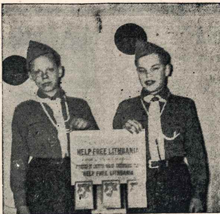
SKAUTAI prie "Help Free Lithuania" atviručių išskobos, Chicagoje. Atviretės platinamos lietuvių pramogose. Pelnas eina skautų fondui.