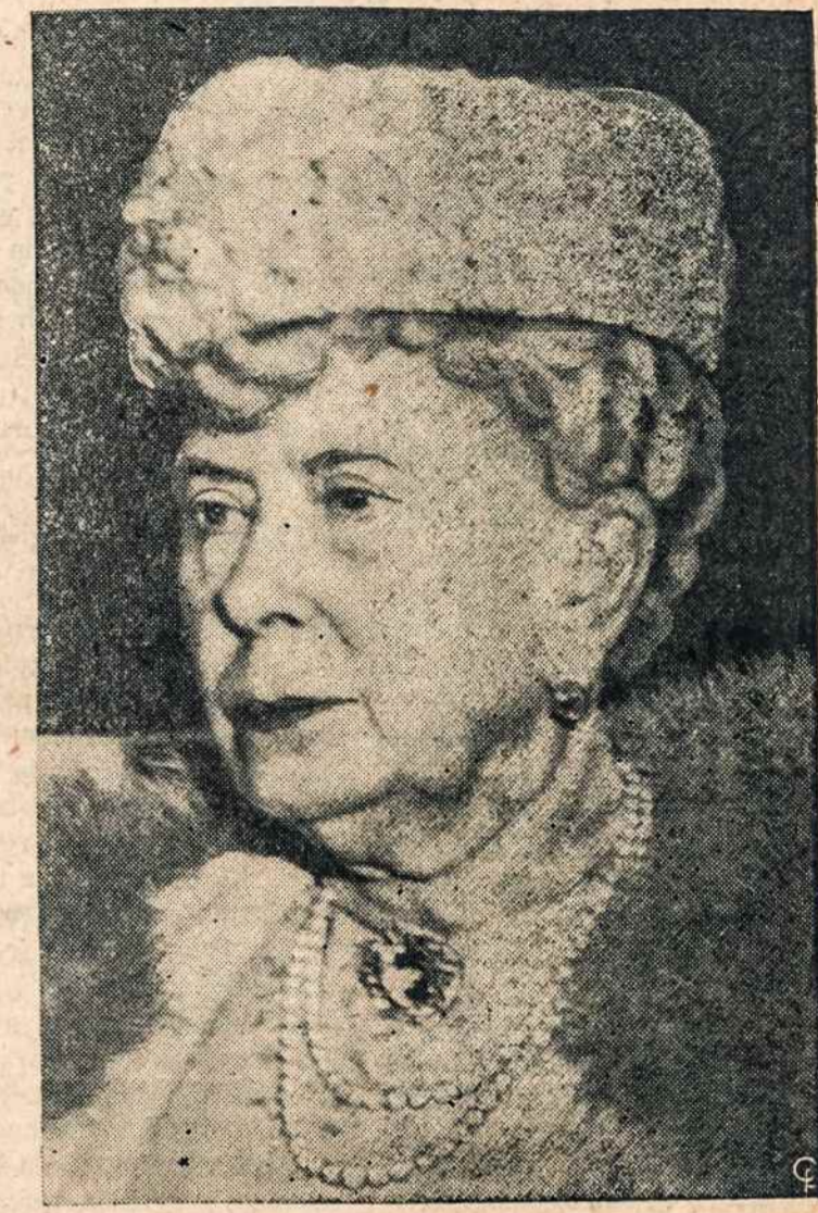
KARALIENĖ MARIJA, dabartinės Anglijos karalienės senelė, mirė prieš kelias dienas.