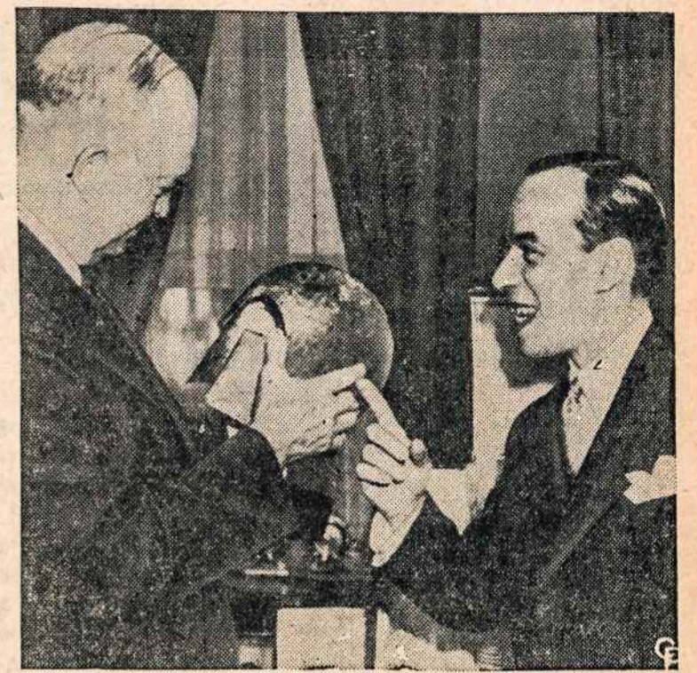
PREZIDENTAS D. EISENHOWERIS gavo dovanų korintiečių sal-mą iš V. Janž, prieš Kristų. Baltuose Rūmuose dovaną jam iteikė Graikijos ministris Spyros Markezinis.

Nužygioju kartą į netoli Kataliku Universiteto esantį Tėvų Pranciškonų Vienuolyną. Tik ne tu, kurie Brooklyne gy-vena ir "Darbininką" leidžia. Prie vienuolyno prisiliejusi graži bažnytelė, kurios tikslas — ugdyti šventosios Žemės brangių istorinių vietų atmini-mą, skiepyti žmonėse Kristaus