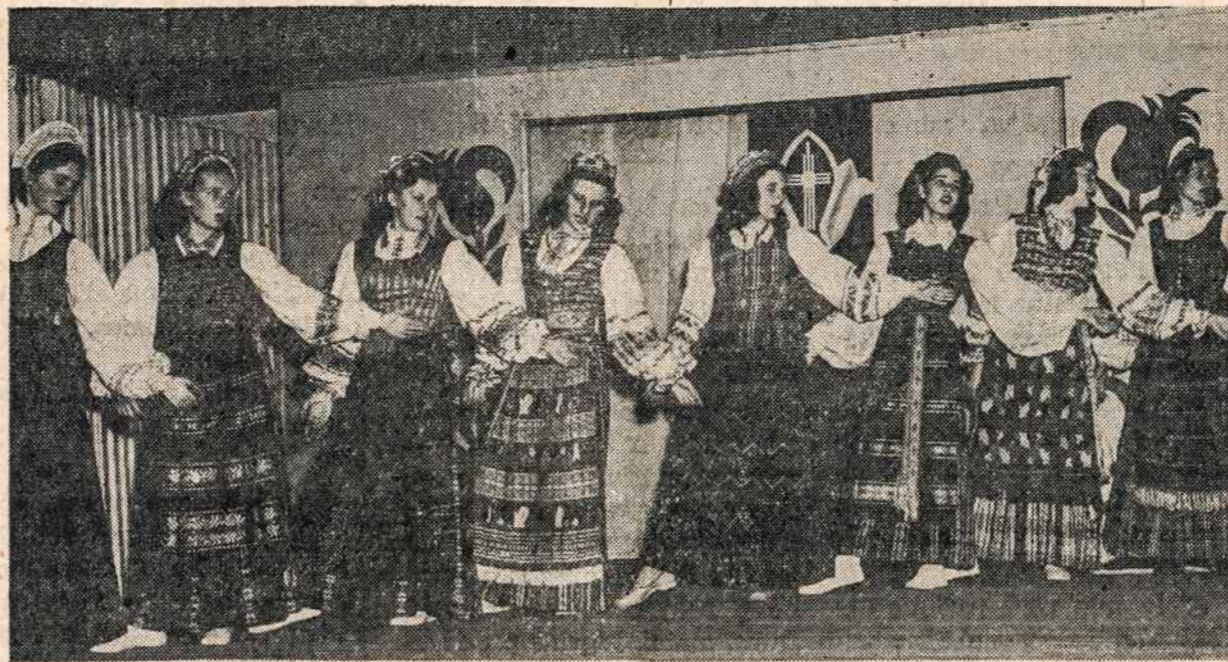
Mergaitės šoka Brocktono ateitininkų kuopos šventėje balandžio mėn. 26 d.