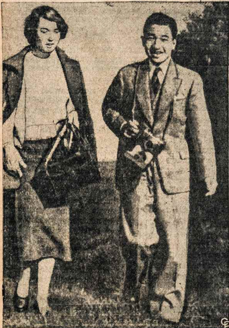
DALKEITH GRAFAITE ir Japonijos sosto įpėdinis, Alkhiho lanko Skotija. Mat, dar yra laiko iki karalienės Elzbietos II vainikavimo iškilniū.

You are Cordially Invited to inspect our Labs and Shops at your convenience.