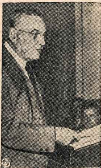
Valstybės Sekretorius John Foster Dulles kalbasi su spaudos reporteriais prieš išvykdamas į Artimuosius Rytus ir Pietų Aziją.