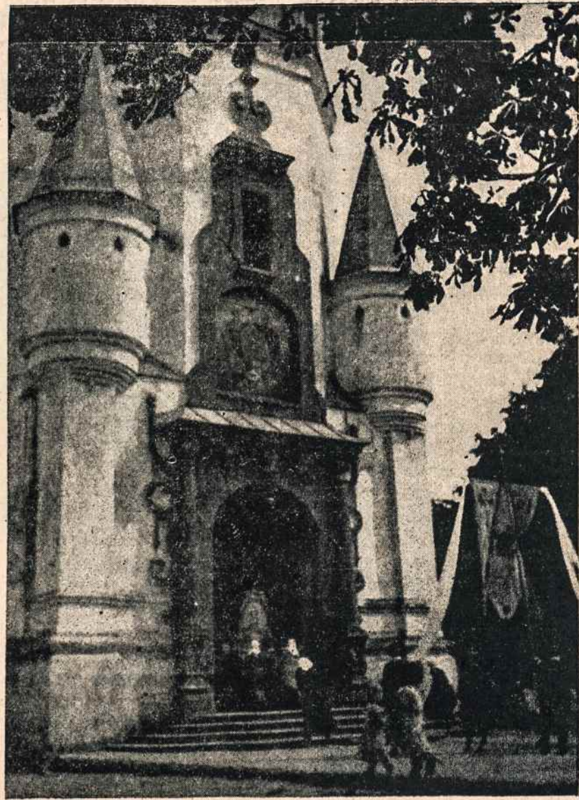
Gegužinė procesija Šiauliuose

Gi pačiai "Laisvei" nėra ko veržtis į lietuviškus reikalus. Juo labiau į Dariaus-Girėno pagarbimą. Šiėdu didvyriai nieko bendra neturėjo su "L." atstovaujama probolševikine linija. Darius buvo Lietuvos kariuomenės savanoris - kūrėjas. Jis kovavo su ginklu rankoje, rizikuodamas gyvybe, ir ne "Laisvės" įkvėpėjų, Lietuvos okupantų pusėje, bet laisvos Lietuvos pusėje — prieš jos priešus. Darius Lietuvoje savo jėgas skyrė ne komsomolcams organizuoti, bet Lietuvos jaunimui sportinio veržlumo ir