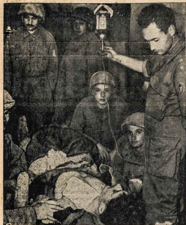
KRAUJO TRANSFUZIJA daroma sužeistam Korejoje kariui. Jei gali, ir pats duok kraują.