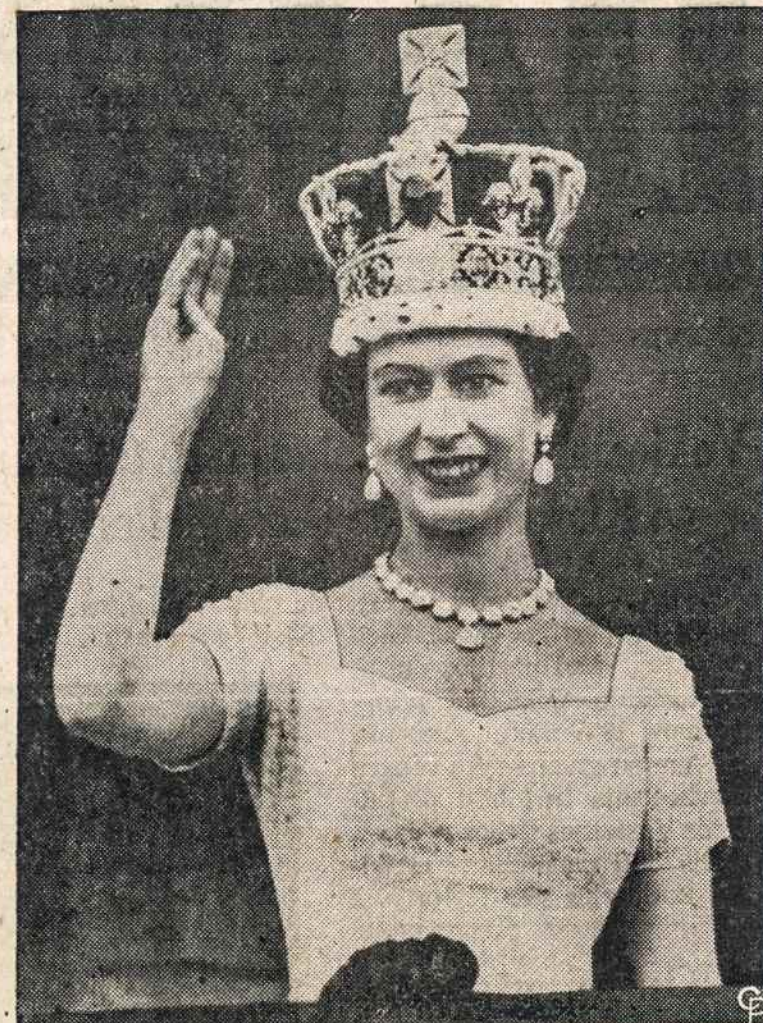
KARALIENĖ ELZIETA II su Britanijos imperijos karūna.

Automobilis bus duotas kuriam laikui kiekvienai programoje dalyvaujančiai valstybei susipažinti bei radaro studijoms tirti. Be to, studijų metu bus gildenami ir kiti judėjimo klausimai: vairuotojo pastabumas, ženklai ir greitį reguliuoją įstatymai. (Skelb.)