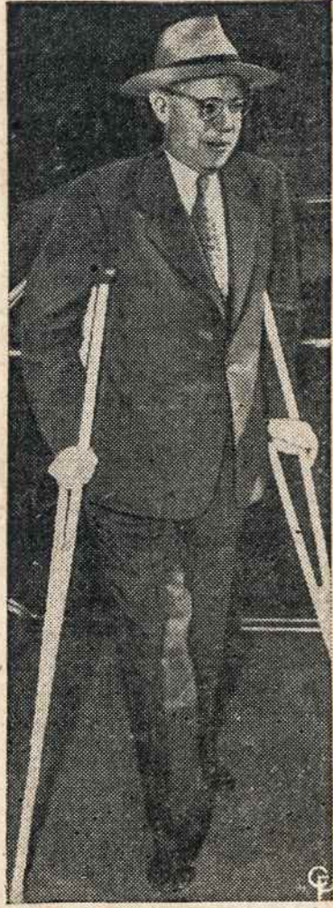
SEN. ROBERT A. TAFT, respublikonų partijos lyderis ir buvęs kandidatas į prezidentus, dvi savaites išbuvo ligoninėje Washingtone ir Cincinnati. Jam skauda klubą. Čia jis ateina į Baltuosius Rūmus konferencijai su prez. Eisenhoweriu.

ir prie Vokietijos prijungtas Klaipėdos kraštas.