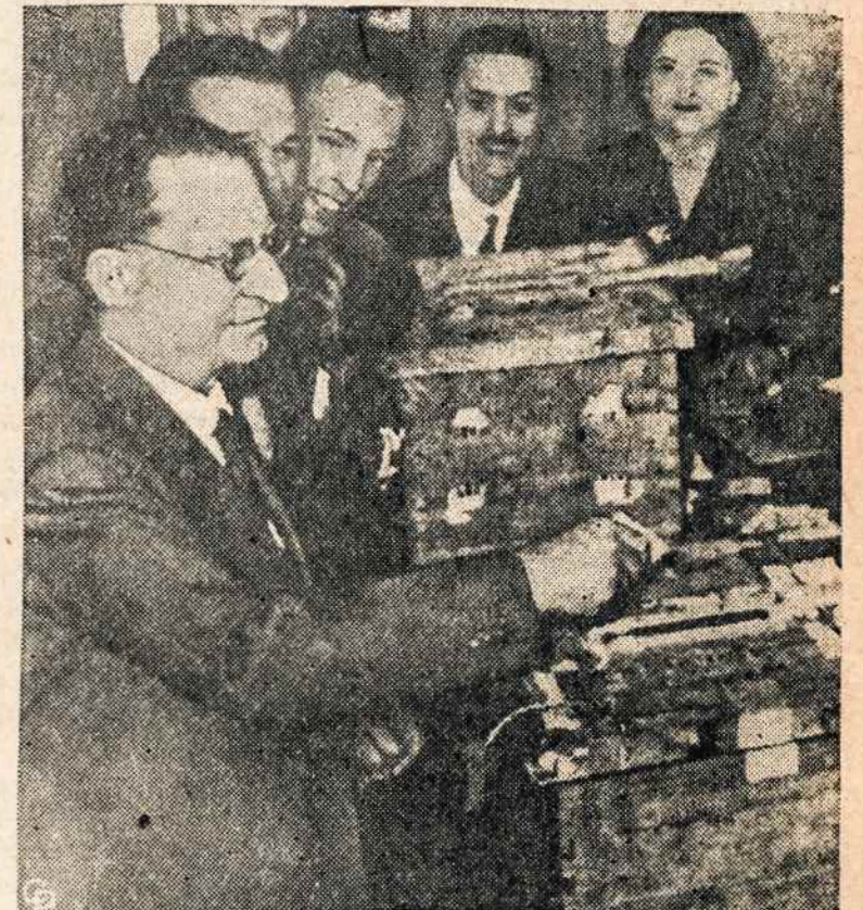
ALCIDO DE GASPERI, Italijos ministeris pirmininkas, balsuoja Romoje. Jis tikras, kad komunistai nelaimės. Rinkimų metu tvarkai palaikyti buvo mobilizuota 200.000 policininkų. Rinkimų rezultatai paaiškės tik po kelių dienų.