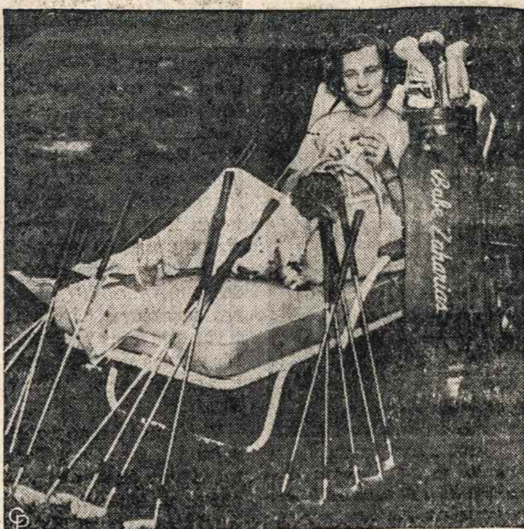
MRS. MILDRED DIDRIKSON ZAHARIAS po sunkios operacijos taso sveikatą, mėgdama kojinės golfo žaidimui. Vadinama "Babe" ji yra viena iš žymiųjų Amerikos moterų atletų.