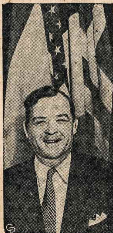
Dr. Luter Evans, Amerikos Kongreso bibliotekarijus, šypsosi Paryžiuje prie vėliavų, sužinojęs, kad jis specialioje sesijoje yra paskirtas JT Ekonomijos Tarybos vyriausiuoju direktorium.