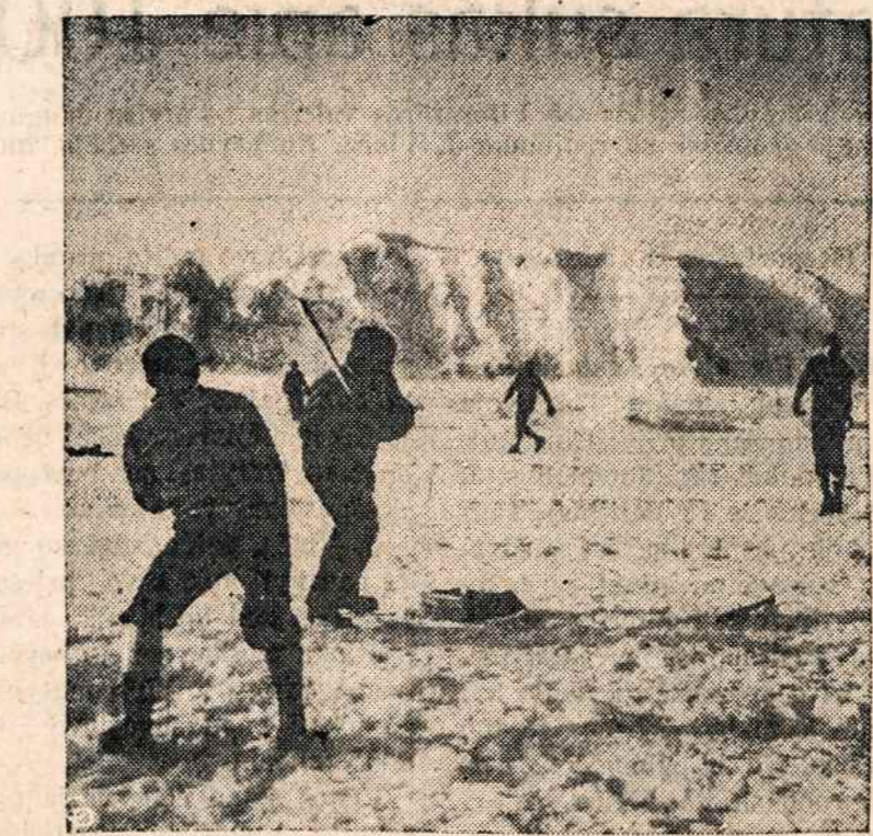
SIEMS PAKRANČIU APSAUGOS ledlaužio Noriwhind igulos vyrams atpuola per vasaros kaitras atsivėsiniimo problemas. "Karščius" pralaidžia Beringos jūroje bekovodami su ledais.

• Pelningiausia dabar profesija yra "talkos apaštalu". Joje Trygve Lie teišbuvo tik 7 metus kaip Jungtinių Tautų gen. sekretorius, tesuorganizavo tik du karu, bet uždirbo 385,000 dol. algos. Kad nebūtų skausminga nuo profesijos pasitraukti, JT dar pridėjo 20,000 atsisveikinant; o kad nereiktų pasitraukus dirbti ne savo profesijoje, visam amžinui paskyrė pensijėlę metams