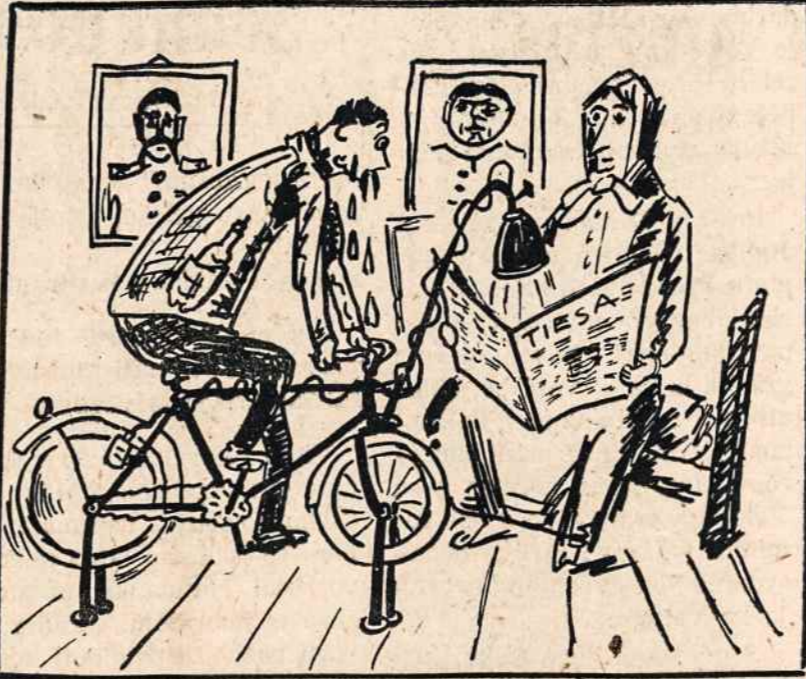
Vilniaus radijas paskelbė, kad Lietuvos kolechozuose jau įvesta elektros šviesa.

bimba — nerangus žmogus, nenauddelis; dilba — paniūrakis, niūronas, (paniūrėlis); gurnius — girnalkalis (galis kalti ir ne akmenis); juška — užvožas, kaštis (tinka užkšti ir visuomeninio judėjimo skylėms); kisielius — avizinių miltų valgis (galima pritaikyti medicinoje kaip vaistą); katilius — katilų dirbėjas arba taisytojas (gali taisyti ir prakurčiusius partinius puodus); pakalniškis — pakalnės gyventojas (žmogus, kuris pastoviai laikosi prie pakalnio); rūkas — migla, ūkas (paprastai pilksvos spalvos, bet dėl orinių atmainų galis ją ir keiststi); skardžius — status upės krantas (tautosakoje virtęs keiksmu: kad su skardžiais nugarumtum); sruoga — pluoštas, siūlų vynė (tolka); vėbra — išsižiojėlis, žioplys, vėpla (yra irgi išimčių); zaurius — plepys, tauškalas (jei diplomatas, tai pasako, kas