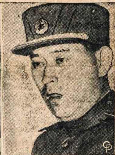
Gen. Nam Il