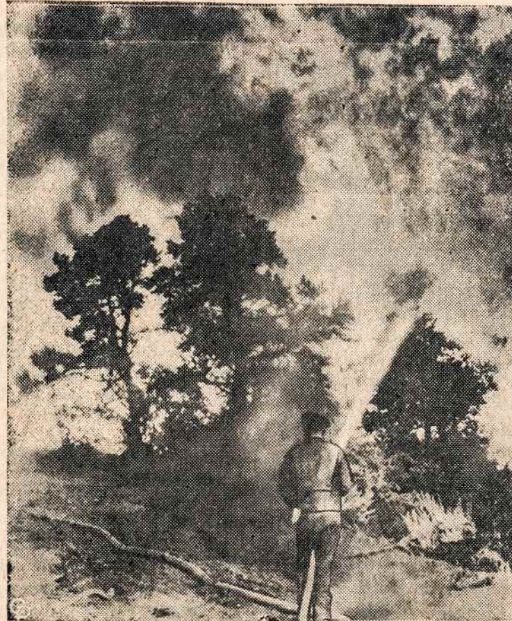
NATIONAL FOREST prie Los Angeles kilęs gaisras sunaikino 14000 akrų miško ir 20 pastatų. Gaisrą gesina virš 1000 savanorių