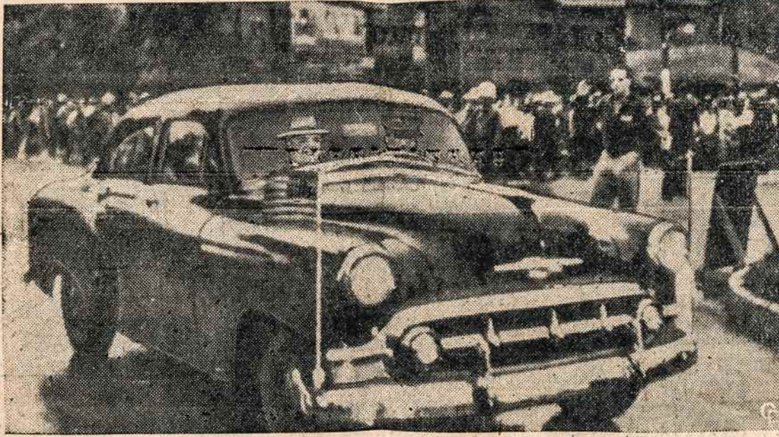
WALTER S. ROBERTSON, Valstybės sekretoriaus padėjėjas, sveikinamas tūkstantinės pietinių korejiečių minios pakelyje ir prezidento rūmų deryboms su prez. Syngman Rhee.

Iš buvusių 265 popiežių 74 yra paskelbti šventaisiais. Paskutinis iš jų paskelbtas palaimintuoju popiežium Pijus X, kuris yra paskelbęs ir šūkį "Viską atnaujinti Kristuje". Jį savo šūkiu turi ir ateitininkai. Mūsų šimtmečiui priklauso jau penki popiežiai: Leonas XIII, Pijus X, Benediktas XV, Pijus XI ir Pijus XII.