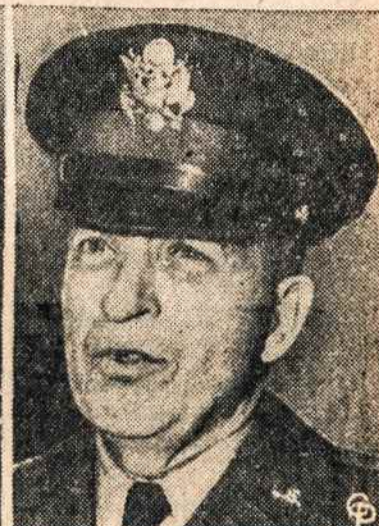
Lt. Gen. William K. Harrison