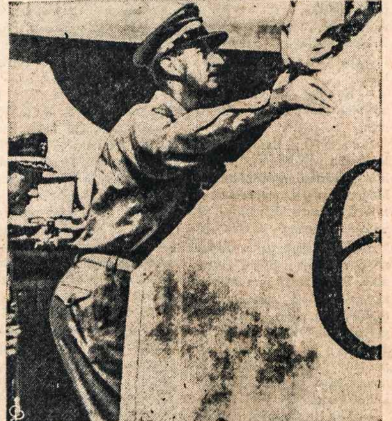
Gen. Mark Clark, JAV vyriausias karo vadas Tolimuose Rytuose, iš Tokyos buvo nukreiptas į Koreją pasirašyti karo paliaubų sutarties iš JAV pusės.

Bonnos politiniuose sluoksniuose aiškinama, kad Maskva atsisakysianti vis dėlto nuo konferencijos.